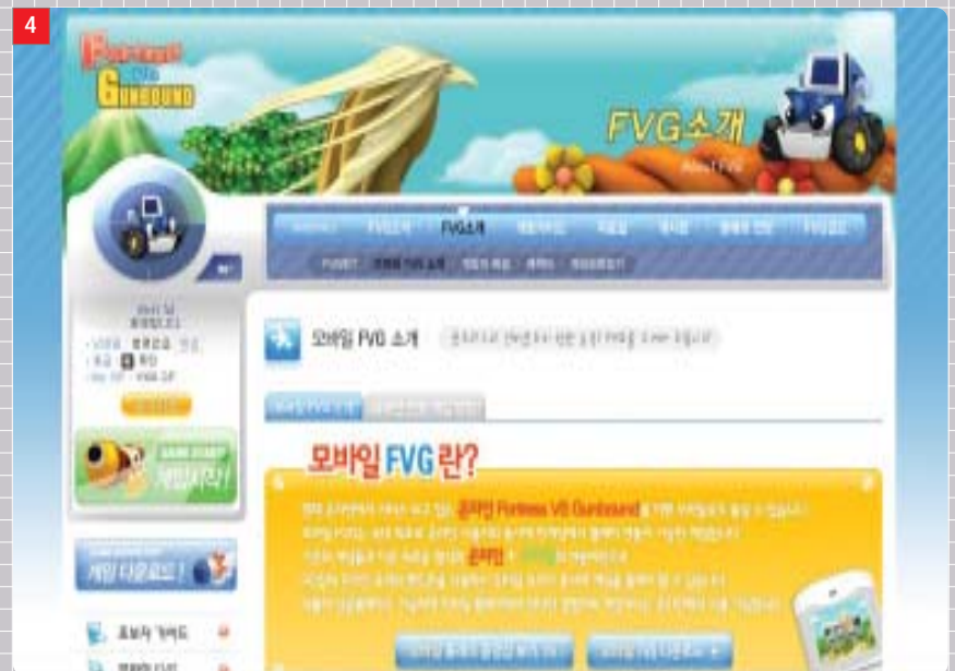
4 모바일 유저와 PC 유저의 한 판 대결, 포트리스와 건바운드로 맞짱 뜨는 게임 포털 망몽에서 운영하는 FVG 게임 사이트