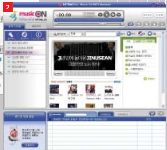
1 최근 모블로그 기능을 도입한 마니아 블로그 사이트 이글루스. 2 LGT에서 12월 오픈한 뮤직온 서비스의 MP3 매니저 화면.