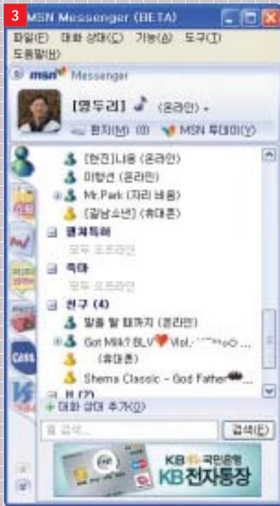
3 휴대폰에서도 인터넷용 인스턴트 메신저를 이용하는 것은 이제 일반화돼 있다.

모블로 그처럼 빠른 정보를 제공하거나, 모바일 메신저처럼 언제 어디서나 동일 환경을 이용할 수 있거나, 지식검색처럼 당장 급한 정보를 구할 수 있는, 그러면서도 약간의 비용 부담이나 입력 및 작동 불편마저도 감수할 수 있을 정도의 사용자 니즈(Needs)는 앞에 설명한 서비스 이외에도 생활 곳곳에서 발견할 수 있다. 또 이런 다양한 콘텐츠의 개발을 통해 유선 콘텐츠와 무선 콘텐츠의 구분이 희미해질 것으로 전망된다.☺