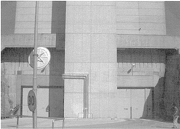
포르스마르크 방폐장의 해저 터널 입구. 사진에서 보이는 왼쪽 입구는 폐기물 반입 입구이고, 오른쪽은 방문객들이 드나드는 입구.

스웨덴은 중·저준위 방폐장을 건설하기 위해 지난 1977년부터 4년에 걸쳐 모두 3개의 후보지에 대한 타당성 평가를 거쳤다.