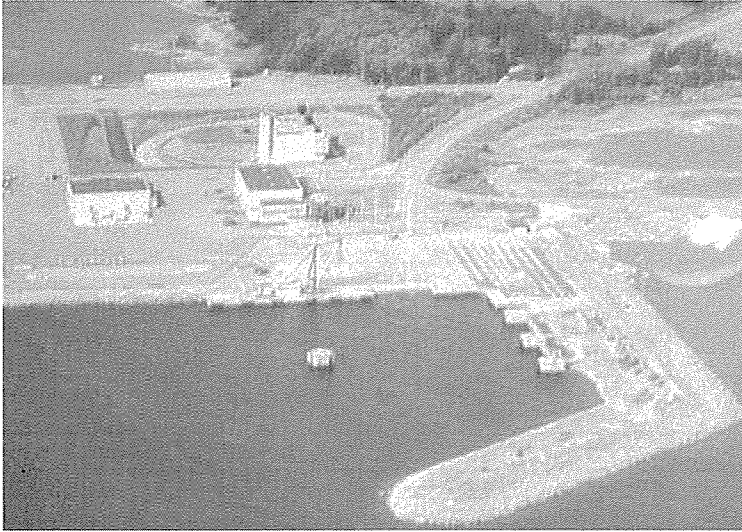
포르스마르크 방폐장의 전경. 사진 아래 부분 바다가 해저 터널이 뚫린 곳이다