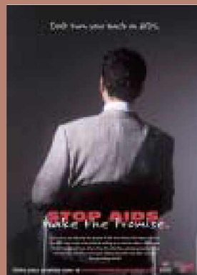
▲ 세계에이즈의 날 캠페인 포스터들