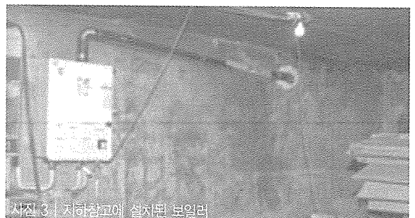
사진 3 | 지하창고에 설치된 보일러

2003년 12월 16일 9살과 8살된 오누이와 어머니가 서울 서대문구 충정로 소재 단독주택 반지하에서 변사체로 발견됐다. 가스안전공사사고조사반, 서울 서부지사 사고조사반, 서대문경찰서 형사들과 과학수사반이 현장 합동조사를 실시, 현장 조사 결과 자연배기식 보일러에 강제배기팬이 부착된 제품을 사용하고 있던 이 가정은 우선 보일러가 전용보일러실이 아닌 장소(주방 겸 다용도실)에 설치되어 있었고, 강제배기팬의 전원플