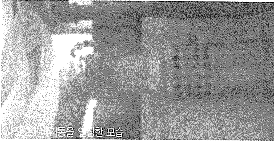
사진 2 | 배기통을 완성한 모습

이 사고의 문제점은 주택의 일부를 확장·개조하면서 무자격자가 가스보일러 배기통의 재료를 접합하지 않은 것을 사용한 것이 원인이었다. 또 다른 이유로는 이렇게 부적합한 시설이 있음에도 불구하고 공급자가 안전점검을 실시하면서 적합하게 처리하였다는 것이 또 하나의 사고원인이라 할 수 있다.