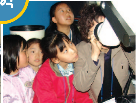
대전 시민천문대에서 별 여행 "선생님, 진짜 별 보여요?"