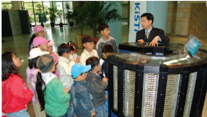
"이게 슈퍼컴퓨터라구요? 마술상자 같은데?"