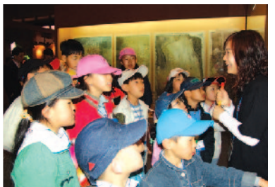
국립중앙과학관 고구려대탐험전 "고구려 사람들은 이렇게 살았구나!"