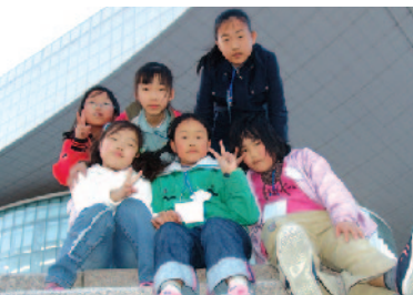
대전문화예술의전당 사랑음악회 "이렇게 예쁜데서 공연 본다는게 꿈만 같아요!"