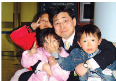
"아빠같은 과장 아저씨"