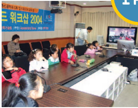
엑세스 그리드 체험 "와, 텔레비전 속에 친구들이 나와요!"