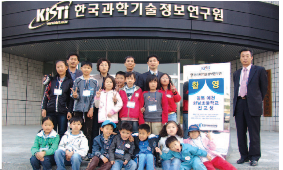
"과학자가 돼서 꼭 다시 만나요!"