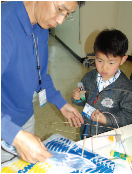
모형비행기 만들기 "과학자 아저씨, 비행기 어떻게 만들어요?"