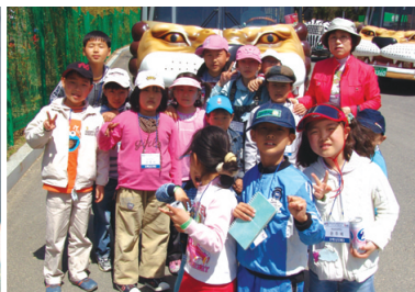
대전동물원 "우리 이제 사자 만나러 가요"