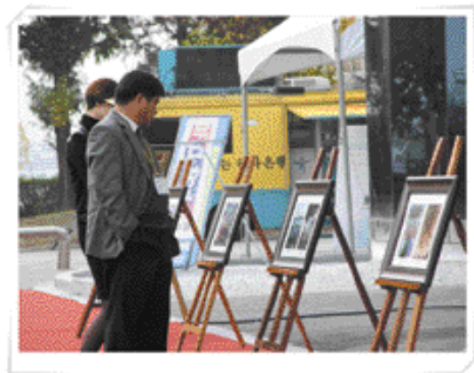
○ 입선작들은 2004 WATER KOREA 행사시 사진전을 통해 일반시민에게 전시되었다.

환경부와 협회는 앞으로도 모든 시민들이 쉽게 공감하면서 참여할 수 있고, 물사랑·물절약에 자부심을 심어주는 다양한 홍보 이벤트를 개발, 지속적으로 추진할 계획이다.