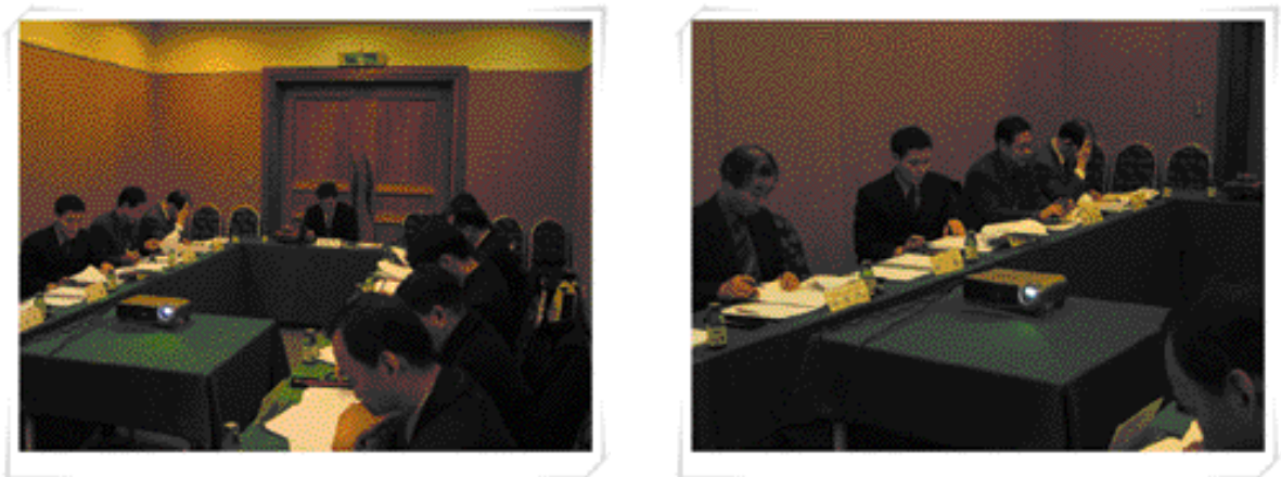
지난 12월 21일 서울교육문화회관에서는 협회의 인증심의위원 11명이 참석한 가운데 제9차 기타여과방식 및 추가소독능 인증심의위원회를 개최, 서울특별시 구의정수장과 5개 정수장의 인증심의를 마쳤다.