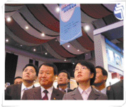
④ 7개국 133개 업체가 참가한 이번 전시회는 국내 물산업의 현주소를 한눈에 볼 수 있을 만큼 각 업체가 자랑하는 최신 상하수도 신제품 및 신기술이 선보여 관람객들의 눈을 즐겁게 하였다.