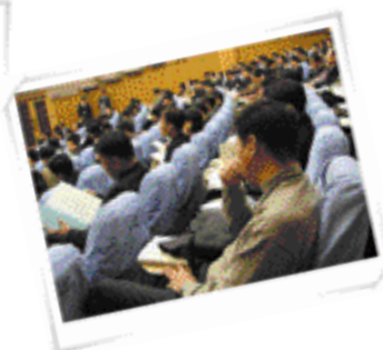
📍 전국에서 모인 약 200명의 하수도 공무원들로 연찬회장이 가득 메워졌다.