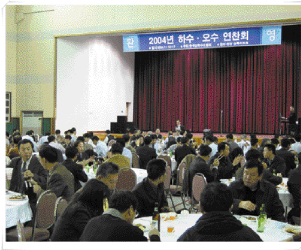
④ 행사후 마련된 만찬을 통해 전국에서 모인 하수도 공무원 및 관련 전문가들은 친교의 시간을 가졌다.