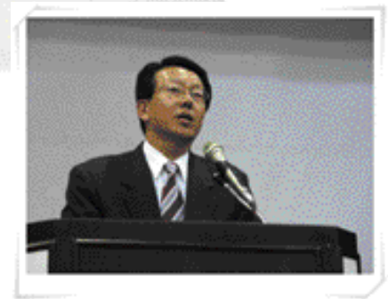
📍 축사를 하는 류영창 환경부 상하수도국장