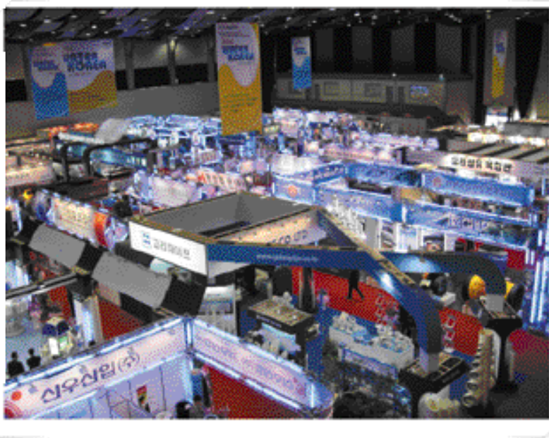
☉ 위에서 바라본 국제상하수도전시회장 전경

☉ 행사 참관등록을 위해 관련 공무원 및 일반시민들로 북적대는 등록대 전경