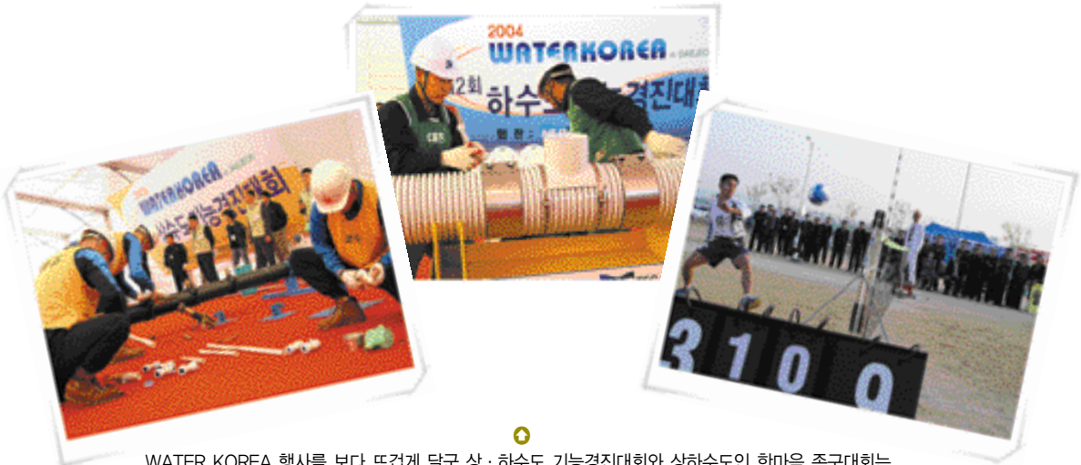
WATER KOREA 행사를 보다 뜨겁게 달군 상·하수도 기능경진대회와 상하수도인 한마음 족구대회는 특·광역시·도 대표간의 열띤 경쟁으로 풍성한 볼거리를 제공하는 동시에 오랜만에 우의를 다지는 자리를 마련하기도 했다.

❶ 행사기간 중 야외에 마련된 물사진 전시회는 참관객 동선에 따른 사진배치를 통해 참관객 및 시민들에게 물의 소중함에 대한 인식 제고 및 협회 이미지 고양에 한 몫 했다는 평가를 받았다.