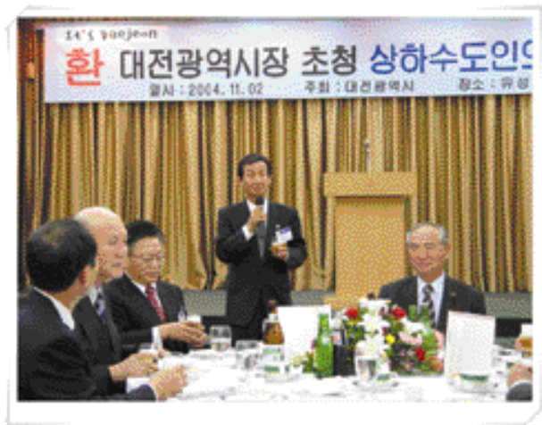
④ 광결호 환경부 장관이 대전광역시장 초청 만찬으로 이루어진 상하수도인의 밤 행사에서 전국 상하수도 종사자들의 건강과 발전을 기원하는 축배를 제의하고 있다.