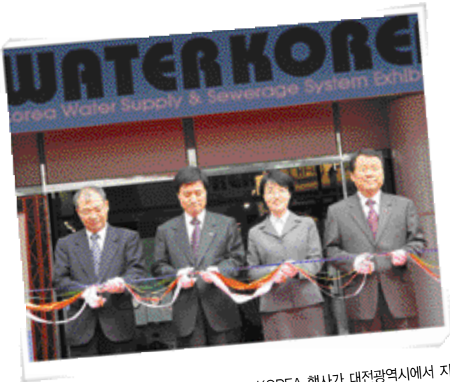
☉ 국내 대표 물박람회인 2004 WATER KOREA 행사가 대전광역시에서 지난 11월 2일 개최, 내외 인사들이 축하 테이프 커팅을 하고 있다. 왼쪽부터 이환기 한국수자원공사 부사장, 허남식 한국상하수도협회장(現 부산광역시장), 박선숙 환경부 차관, 염홍철 대전광역시장