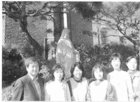
가정 호스피스 회원들