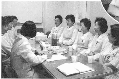
▲ 사별가족 지지 팀 모임