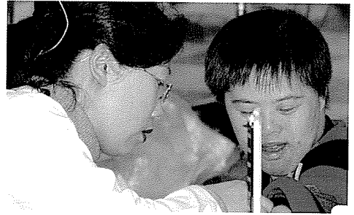
▲ 경기지부는 노인복지시설 생활자, 아동복지생활 시설자 등 800여 명에게 무료건강검진을 실시하였다.