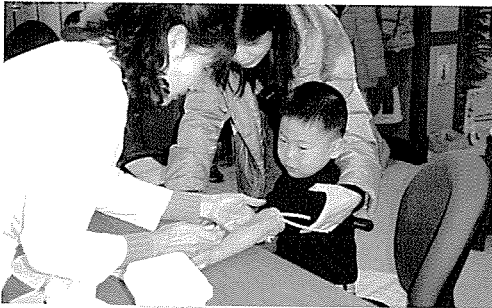
▲ 전북지부는 장애인시설 생활자, 일반주민 등 1100여 명에게 무료건강검진을 실시하였다.