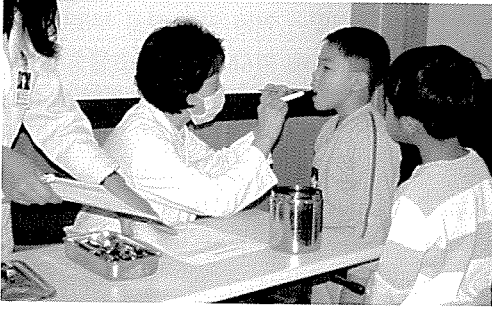
▲ 서울지부는 아동복지시설 생활자, 일반주민 등 50여 명에게 무료건강검진을 실시하였다.

지난 1월 한달 동안에도 3천 1백 7십여 명에게 무료건강검진과 건강상담을 실시하여 아름다운 만남을 실천하였습니다.