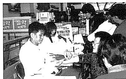
▲ 대구 무료검진 현장