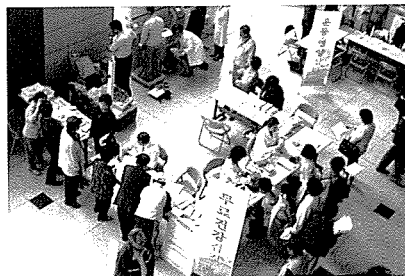
▲ 중앙검진센터 무료검진 현장