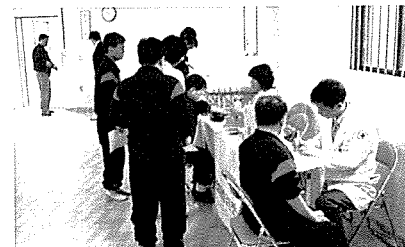
▲ 대전·충남 무료검진 현장