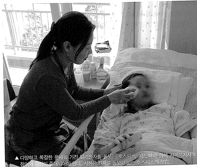
▲ 다양하고 복잡한 문제를 가진 말기환자를 돌보는 호스피스 제도와 함께 사회복지사의 참여의 관심이 증대되어야 한다. 사진은 환자를 돌보고 있는 호스피스의 모습.