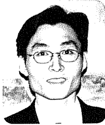
글 : 박 상 진 _ 사회복지사, 공인노무사, 노무법인 휴먼 대표