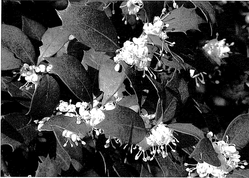
구골나무의 꽃과 잎(11월 7일, 대구의 동대구로에서).