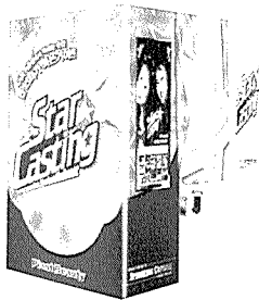
▲ 신제품 '스타캐스팅'

스티커자판기 분야로 독보적 아성을 구축하고 있는 대승인터컴이 지난 11월10일(금)부터 13일(일)까지 일산 킨텍스에서 개최된 2005 게임쇼(G-Star)에 참가했다.