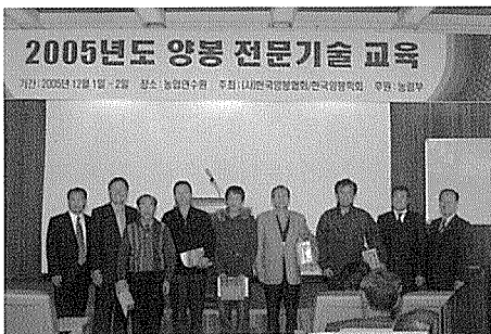
↳ 교육우수자 시상

또한 여성수강생들에 대해서는 불편했을 타지에서의 교육을 묵묵히 수료한데 대하여 소정의 기념품을 증정했다.