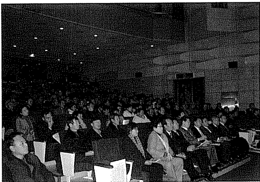
나주시 예술회관에서 양봉농가 및 관련학계교수 등이 참석한 가운데 발표 내용을 경청하고 있다.