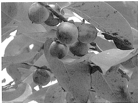
고욤나무 열매. 꽃도 열매도 감보다 훨씬 작지만 가지에 다닥다닥 많이 달리므로 양봉에는 고욤나무가 감나무보다 더 유용할 수도 있을 듯하다.

경상북도 청도는 씨 없는 감으로, 상주는 꽃감으로 유명하다. 청도에서는 씨가 없다가도 그 나무를 고개 넘어 경산에 심