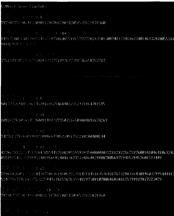
(그림 3) 전자서명 및 검증 결과

본 논문에서 구현한 애플리케이션의 실행 결과는 (그림 3)과 같다. 전자서명 애플리케이션과 검증 애플리케이션에 의해 R, S 값을 계산하여 전자서명이 이루어지고, 서명된 값과 공용키, 사용된 키 값에 따라 서명의 검증이 올바르게 수행되는 것을 볼 수 있다.