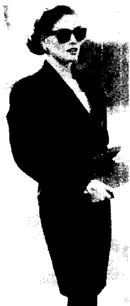
<그림 1> 20th century fashion

에서 권위와 존경을 얻어내는데 기여했고, 섹슈얼리티와 여성성을 조절했다. 남성복에서 기원한 넓은 딱딱한 어깨 패드는 권위와 힘, 여성의 해방을 의미하는 80년대의 상징적 유행 이미지를 부여했으며 가슴을 덮는 재킷은 여성성을 제거함으로써, 여성들은 남성들과 어깨를 나란히 하고 모든 분야에서 동등한 위치를 찾으려 하였다. 1980년대에 여성의 사회진출이 가시적으로 증가하고 여성전문직 증역이 등장한 배경에서 전문직 여성의 권력 이미지가 강하게 등장하였는데 직장 여성이 성공하기 위한 의복 지침이었던 파워 드레싱은 전통적으로 남성의 영역이라 생각되었던 직장에서 남성적인 비즈니스 슈트로 가장한 여성들은 이성적이고 효율적인 능력을 발휘하는 것으로 기대되었고 이러한 능동성과 권위이미지는 파워 슈트를 통해 가시화 된 것이다. 이 스타일은 권위 이미지를 가시화하는 유니폼이었고 일종의 반(反) 패션(anti-fashion)이었다. 여파의 파워 슈트는 남성의 영역에서 역할과 책임을 맡게