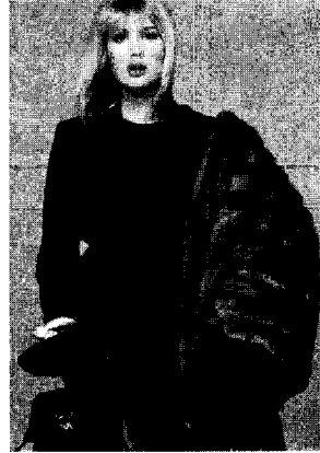
<그림 7> 1987. 9 Vogue USA

외모가 중요시되는 변화무쌍한 라이프스타일 속에서 사무실에서의 고급소재의 슈트 뿐 아니라, 밤에는 자선모금행사나 공식적인 모임에 참석할 수 있는 화려한 이브닝드레스를 착용하여 낮에 감추었던 여성미를 마음껏 발산하였다. 또한 운동으로 몸매 조절을 할 때에는 유명상표의 운동화와 레오타드를, 여가시간에는 디자이너 상표의 진과 스웨터 등을 착용하여 T.P.O에 따른 전형적인 타입을 만들어갔다. 디자이너들의 상표는 자신의 경제적 능력과 사회적 성공을 가장 잘 과시할 수 있는 도구였으며, 디자이너들은 여피들이 원하는 대로 속옷부터 코트까지 모든 상품을 브랜드를 과시할 수 있는 방향으로 디자인하여 매 시즌 스타일과 색채를 바꾸어가며 상표명을 부각시킬 수 있는 디자인을 보여주고 있다. 소비자들은 명품 지향 심리를 통해 진품을 갖고 싶어 하고, 다른 사람과 구별되는 희소성을 지닌 명품에 대한 독점적 가치를 원하면서 자신의 성공을 표현하였다. 이들의 패션은 의복에서 구두, 액세서리에 이르기까지 최고급, 일류만을 추구하여 일류 브랜드 상품과 진짜 보석만을 선호하였다.