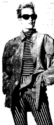
<그림 5> 1987. 02.Vogue USA