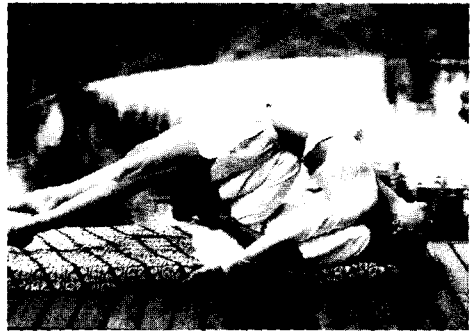
<그림 12> 소프트 스포츠

80년대 스타일에서 영감을 받은 디자인 사례를 살펴본 결과 스포츠와 관련하여, 2002 F/W 루이비통과 알렉산드로 델라쿠아(Alessandro dell'aqua), 2003 F/W 마이클 코스키의 경우 고급스러우면서도 도시적인 스포티 캐주얼 스타일을 표현한다. 몸매를 드러내는 블루준과 레깅스 등 80년대 캐주얼 스타일에서 영감을 받은 시티 웨어로, 여성의 능동성, 건강미, 활동성을 표현한다. 지퍼나 아웃포켓 같은 실용적인 디테일이 더해지거나, 아웃도어 감각의 파카를 매치하는 등 액티브 스포츠에서 영감을 받은 실용적이고 스포티한 스타일을 제안한다. 03/04 F/W 클로에(Chloe)는 고급스러우면서도 도시적인 스포티브 무드, 부드럽고 여성스럽게 몸매를 드러내는