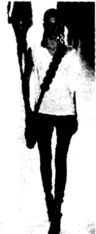
<그림 14> 2003 S/S Celine