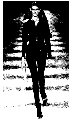
<그림 11> 2003 F/W Gucci