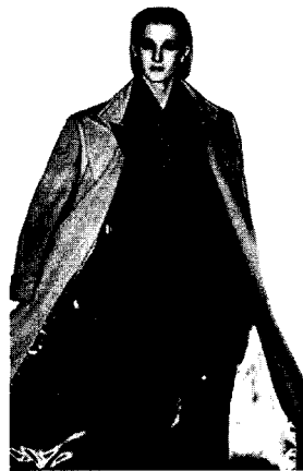
<그림 3> 84/85 F/W Ralph Lauren

<그림 1>, <그림 2>는 크고 넓은 어깨 패드와 가슴을 덮는 재킷, 짧은 스커트의 코디로 전형적인 80년대의 파워 슈트의 예이고 <그림 3>은 1984/85 랄프 로렌의 겨울용 코트와 클래식한 테일러드 슈트로 전형적인 남성적인 비즈니스 슈트 스타일을 보여준다. 비즈니스 슈트인 파워슈트는 1979년 영국의 수상으로 임명된 마가렛 대처(Margaret Thatcher)에 의해 구체화되었고, 네이비블루의 테일러드 재킷, 깔끔한 블라우스, 스커트, 여성적인 스카프로 구성된 파워 슈트는 여성들이 남성적인 영역인 직장