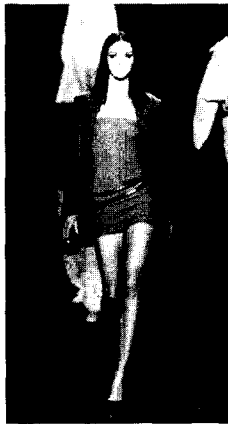
<그림 10> 2003 F/W Michael Kors