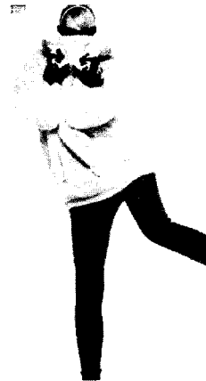
<그림 6> 1985. 07. Vogue USA