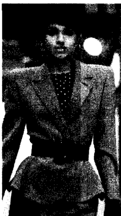
<그림 2> Fashion of a Decade the 1980s