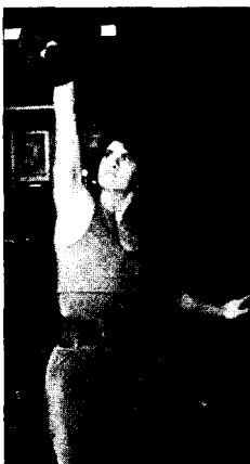
<그림 4> Fashion of a Decade the 1980s

신체 이상미에 대한 위와 같은 인식의 변화와 함께 액티브 스포츠웨어의 아이디어에서 소재나 형을