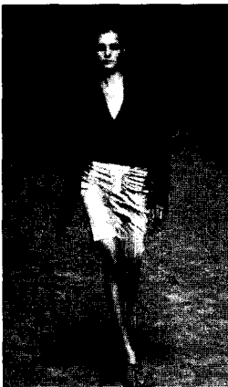
<그림 9> 2003 S/S YSL

2000 F/W 조르지오 아르마니, 마이클 코스, 발렌티노(Valentino) 등은 80년대의 어깨 패드를 응용하면서 동시에 슬림한 허리선과 훨씬 부드러운 라인, 고급스러운 소재와 모피 디테일 등으로 투박하지 않으면서 세련되고 로맨틱하게 디자인을 전개하여 80년대 파워슈트를 섬세한 숙녀 같은 모습으로 모던하게 재해석하고 있다. 2003 F/W 구찌(Gucci) 컬렉션의 경우 들먼 슬리브나 패드된 어깨, 칼라와