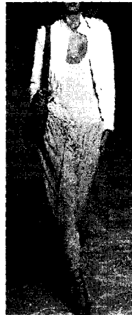
<그림 13> 2003 S/S Chloe