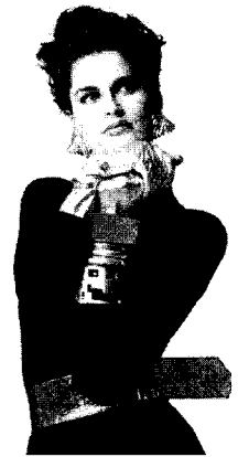
<그림 8> 1985.10. Vogue USA