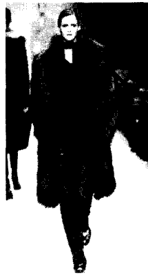
<그림 15> 2002 Alealessandro dell'aqua

일로 80년대 상류층의 부를 상징하던 고급스러운 모피를 사용하나 동시에 젊은 이미지와 함께 표현되며 <그림 15>, 구제품이나 빈티지 제품을 함께 코디하는 다소 보보스적인 패션 스타일도 나타난다. <그림 16> 2000 F/W 콜로에는 80년대 맹목적인 상류층 지향 이미지를 재해석 하여 돌본 슬리브, 기모노 슬리브 등 넉넉하면서 풍성한 소매를 사용하고 80년대 동양권의 영향으로 다양하게 제안된 광택 있는 새틴 실크 소재를 사용하여 매력적인 부유한 숙녀와 같은 스타일을 제안하였다. 2003 S/S 구찌 컬렉션은 80년대 글램 섹시룩과 스포티즘 트렌드가 함께 표현된 스타일로 80년대 경제적 풍요로움에 대한 향수를 반영하면서도 활동적인 여성을 위한 새로운 라이프스타일을 반영한다. 광택감 있는 소재를 스포티하고 캐주얼한 실루엣으로 구성하여 일과를 행하는 동안 편안하면서도 저녁에는 카테일파티에 입고가도 손색이 없는 스타일을 제안했다. 다시 말해서 21세기 새로이 나타나는 파워 우먼의 소비 스타일을 통해 살펴본 과시는 무조건적인 브랜드 신봉을 통한 파워의 과시가 아닌 고가품을 선호하지만, 확실성에서 벗어난 다양하고 은폐된 방향으로의 과시가 나타난다.