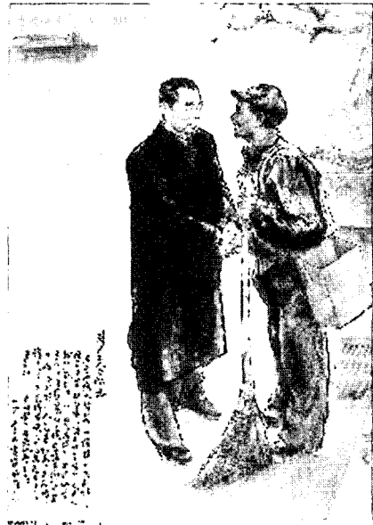
청결노동자의 그림 152×110cm. 1977.