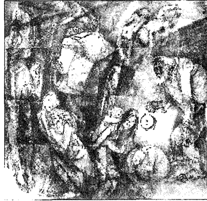
광공도, 고아 174×180cm, 1981.