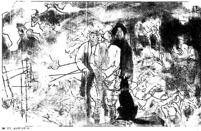
광공도, 동포, 매국노와 개(초고)

일본 방문을 마치고 주사총은 노침과 함께 ‘광공조화’(礦工組畫)를 제작하기 시작했다. ‘광공’의 내용은 중국의 망국의 역사를 표현한 것이다. 노침은 <동포, 매국노와 개>의 일부를 그리고 <왕도락토>(王道樂土), <인간지옥>(人間地獄), <고아>(遺孤)는 주사총이 그렸다. 여기서 주사총은 이전의 수법과는 달리 나라를 잃고 고통 속에서 살아간 광부들의 억압과 아픔을 나타내는 감정의 욕구를 과장과 왜곡적인 표현을 하였다. 그리고 구도는 분할적이고 몽타주와 같은 수법을 사용하여 한 공간