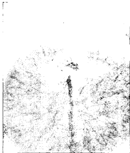
일화일세계(부분), 55×49cm, 1992.