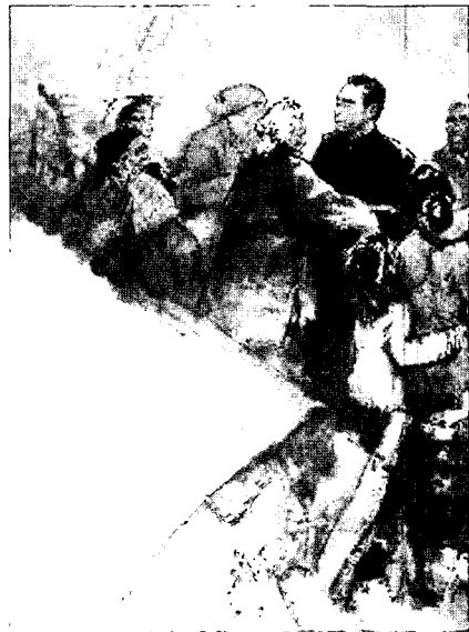
인민과 총리 151×318cm, 1979.

1977년 ‘문화대혁명’이 끝나고 중국은 등소평 등에 의해 개방화 정책으로 나아간다. 1978년 주사충은 강렬한 창작욕구가 생겨 ‘형대룡요’(邢臺隆堯)대지진 구역에 가서 소재를 수집하고 1년 여의 기간을 들여 〈인민과 총리〉를 그려낸다. 이 작품은 형대지진 때 주총리가 재해지구 인민들을 찾은 역사적 사실을 그린 것인데 ‘건국 30주년 경축 미술작품전람’에서 1등상을 받았으며, 이로 인하여 주사충은 큰 명예를 안게 되었다.