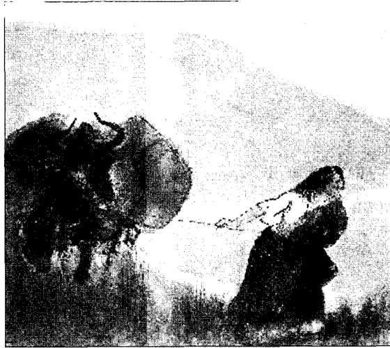
목귀, 33.5×38cm, 1983.

애가 묻어나온다. 즉 ‘이족’들의 삶에 대한 리얼리티가 잘 나타나 있다.