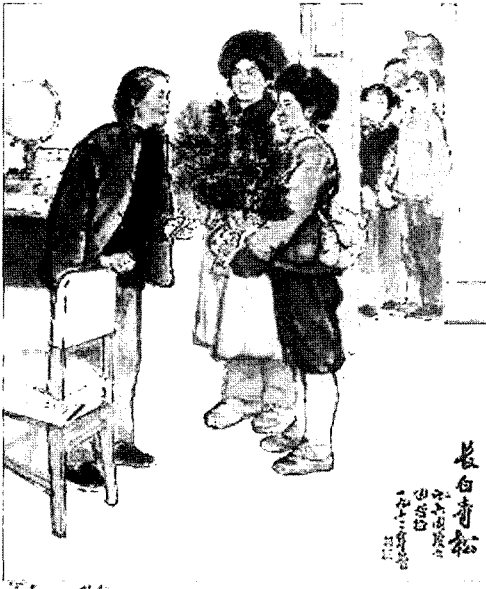
장백정승 112×96cm. 1973.

‘문화대혁명’ 가운데 주사충은 인민 영웅들을 위한 인물화를 그렸는데 작품들은 각종 전람회와 출판물에 실려 호평을 받았으며 그에게 명성을 가져다 주었다. 작품의 주제들은 생활 속에서 찾았고, 그림을 위한 구상을 여러 번 하였다. 창작의 방법은 ‘공농병을 위하여 복무’ 하는 방침에 따라 혁명적 이상주의와 미래에 대한 아름다움을 동경하는 창작을 하는 시기였다. 즉 사회주의 리얼리즘이 추구하는 창작 태도였다. 그리고 그의 창작은 비교적 활동성이 있었으나 개성이 나타나는 작품이라기보다는 사회주의에 봉사하는 ‘문화대혁명’ 시기의 특징을 지니고 있다. 표현 기법은 비교적 간단하였는데 형식으로 경직되어 나타나기도 한다. 이와 같이 그 당시 작품들은 대체로 현실주의를 바탕으로 하여 역사적이거나 사회적인 사건을 주제로