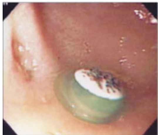
Fig. 2. Esophagogastroduodenoscopic finding: On the post-bulbar portion of the duodenum, blind pouch was noticed. Foreign body was seen in the blind pouch, which was removed by net-catheter. At the center of the pouch, slit like opening was noticed.