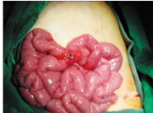
Fig. 3. Intraoperative photograph shows small bowel-mesentery-small bowel fistula caused by the ingested magnets.

진찰 소견: 응급실 내원 당시 활력 징후는 혈압 100/60 mmHg, 맥박수 114회/분, 호흡수 24회/분, 체온 36°C였다. 체중은 12 kg (25~50백분위수), 신장은 90 cm (50~75 백분위수)였다. 환자는 급성 병색을 보였다. 입술과 혀는 중등도의 탈수 소견을 보였으며, 결막은 창백하지 않았고, 공막에 황달은 없었다. 흉곽은 대칭적으로 팽창되었고 양측 폐음은 깨끗하였으며 심박동은 규칙적이고 심잡음은 청진되지 않았다. 복부 진찰상 장음은 감소되어 있었고, 복부팽만 없었으며, 복부전체에서 경한 압통이 있었