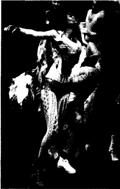
〈그림 9〉 Alexander MacQueen, 02, 03 S/S collection, http://www.elle.co.kr/

로 사용되었던 역사성은 중심적 이론과 경계의 설정, 이분법적 논리, 주체의 강조와 타자의 소외 등