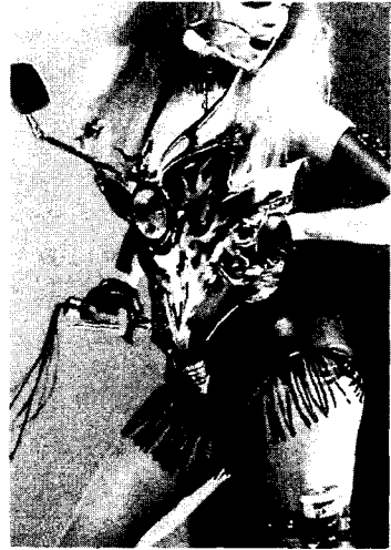
〈그림 5〉 Thierry Mugler, Harley Davidson, 1992, Fashion Today, p. 370.

접한 관련을 맺으며 하나의 패션산업으로 자리 잡았다. 또한 가상현실(virtual reality)을 실제현실로 확대시켜 현실에서 시, 공간적 개념을 초월한 확대현실(augmented reality) 26) 은 신화적 이미지를 명확하게 하여 과거를 현재화시키고 현재를 미래화시키는 시간적 영역확장을 꾀하고 있다. 〈그림 6〉은 온라인 게임에 등장하는 여주인공의 모습으로 게임에 등장하는 다양한 캐릭터들이 착용하는 의상이나