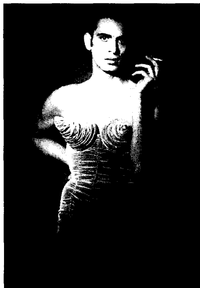
<그림 7> Jean Paul Gaultier, Barbes collection, 1997, Fashion Today, p. 339.

동성애나 양성애는 고대 그리스 시대에는 배타적 영역으로 인식되지 않았던 것으로 이들에 대한 소외는 정치나 종교적 이데올로기와 관련된다. 성적 취향의 이질성은 이들에 의해 악마적인 것, 자연을 거스르는 행위, 변태적인 것 등으로 취급되면서 역사적으로 금기시되어왔다는 정당성을 부여하는 위장을 해왔다. 즉 정치적, 종교적 지배계급에 의해 조작되고 꾸며진 신화와 역사적 이미지들은 성적 소수자들을 성공적으로 억압하였다. 포스트모더니즘과 함께 동성애나 양성애는 상징적 상호주의(Symbolic interaction)에 있어서 진정성(진실성)을 인정받았다. 이는 공유되는 사회가치체계와 의미체계 안에서 상호 주관적인 이해의 과정을 거치는 것으로 패션연구에 있어서의 상호 주관주의(inter-subjectivity)의 타당성과 도입에 의해 이루어졌다. 29) 신화적 이미지의 환상을 지속적인 미적 혁신의 원동력으로 삼고 있는 패션은 성적 소수자들의 패션 요소를 하이 패션에 과감히 도입함으로써 고정되고 배타적인 지배적 이미지를 탈피하여 새로운 영역으로의 확장을 꾀하고 있다. <그림 6>은 여성복식을 착용한 남성성의 모습을 통해 조작된 동성애자의 모습을 표현하고 있으며, <그림 7>은 남성도 여성도 아닌 중성적인 모습을 나타내는 것으로 패션에 있어서의 성적 구분의 무가치함을 상징한다.