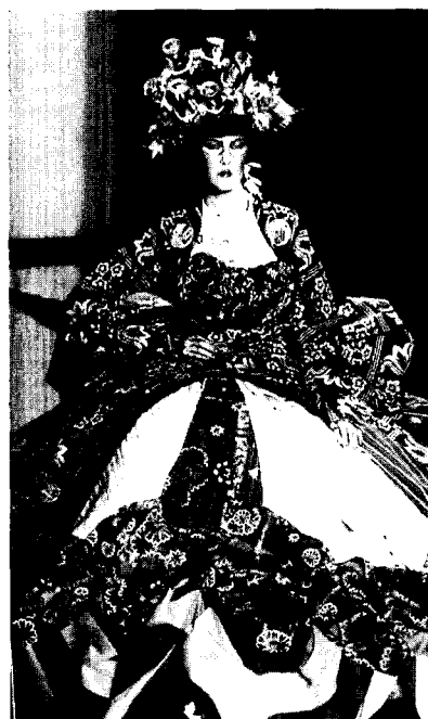
<그림 3> John Galiano 04, 05 F/W collection Fem collection, Vol. 12 Modanews Co., Ltd., 2004.

신화적 이미지의 환상을 지속적인 미적 혁신의 원동력으로 삼고 있는 패션은 성적 소수자들의 패션 요소를 하이 패션에 과감히 도입함으로써 고정되고 배타적인 지배적 이미지를 탈피하여 새로운 영역으로의 확장을 꾀하고 있다. 스트리트 스타일뿐만 아니라 스포츠 웨어의 많은 요소들도 하이 패션에 도입되어 일정한 착장 방식이나 착장 규범을 탈피하여 개인의 취향과 개성을 표현한다.<그림 4> 이러한 절충적 방식은 21세기 유품민의 리즘적 사고 방식을 나타내는 것으로 방향성과 시간성, 공간성을 혼합한 복잡한 양상으로 나타난다. 레트로 패션, 에스닉 패션, 내추럴 패션이 지속적인 패션 트렌드의 화두로 인지되어지는 현대에서는 다양한 품목간의 자유로운 착장 방식(wearing)의 활용이 개성과 주관적 감성 표현의 용이함과 더불어 실용성, 경제성으로 인해 주목받고 있다. <그림 3>은 다양한 시대 복식의 혼합에 일상생활용품이나 잡동사니를 패션 액세서리에 응용하여 역사성과 공간성을 탈피하고 있으며 기존 사물의 위치전도를 시도한 디페이즈망(depaysment)을 통해 충격과 유머를 제공하고 있다.