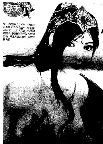
〈그림 6〉 무협 온라인 게임 파천일검의 여성 캐릭터, The Daily Focus, 2004. 11. 2.