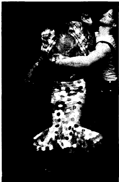
〈그림 10〉 Alexander MacQueen, 02, 03 S/S collection, http://www.elle.co.kr/

의 논리로 인해 중심적 담론에서 배제되고 있다. 역사적 사건의 강조(내러티브적 서술구조)보다는 일회적이고 우연성을 강조한 헤프닝, 퍼포먼스가 중시되면서 이를 이용하여 소외되었던 타자성을 강조하거나 지배구조를 조롱하여 언캐니함을 의도한 각종 패션쇼가 개최되고, 역사가 아닌 자연성을 강조한 많은 의상작품들이 제작되고 있다. 〈그림 9, 10〉은 퍼포먼스 형식으로 개최된 알렉산더 맥퀸의 02, 03 S/S collection이다. 이것은 기존의 광고를 목적으로 하는 패션쇼의 목적에서 벗어나 패션 쇼 자체를 놀라움과 흥미를 유발시키는 예술적 행위로 확대시키는 문화적 확장현상을 보여준다.