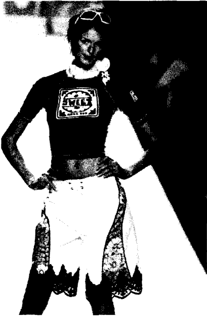
〈그림 4〉 Anna Sui 02, 03 S/S collection Elle Korea, 2002, April.