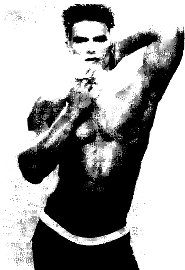
<그림 1> Calvin Klein. 1996 Fashion Today, p. 229.

이 주는 수동적인 성적 매력과 팜프 파탈의 적극적인 성적 유혹을 동시에 드러낸다. 이는 여성의 수동적이면서도 능동적인 성욕에 대한 이해를 바탕으로 어느 한 쪽으로 편향되어 평가되었던 여성의 이미지에 대한 균형적인 해석으로의 방향전환을 보여준다.