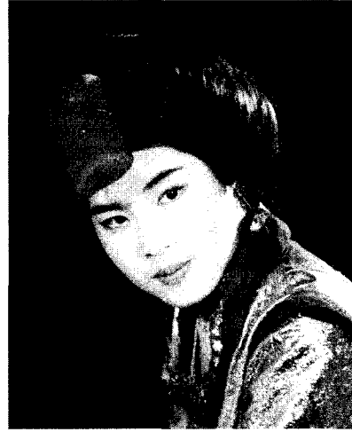
〈그림 10〉 唐여인의 헤어스타일 再現(何建國等編, 『唐代婦女髮髻』, 香港審美有限公司, 1987, p. 30)

다만 직접적인 증거는 되지 않지만 참고자료로서 『唐書五行志』 18) 와 『朝野僉載』의 기사를 들 수 있다. 唐代 中宗의 딸, 安樂公主가 백조의 깃털로 치마를 만들어 입었는데 보는 위치에 따라서 색깔이 달랐으며, 이것이 당시에 유행이 되어 들새가 줄어 들었다라는 이야기가 있다. 당시 새의 털을 가지고 의복을 만드는 것이 현대 여성들이 밍크코트를 선호하