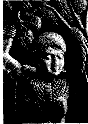
〈그림 3〉 인도 바르후트타 약쉬니, B.C.2세기 (『世界の博物館』, カルカッタ 美術館, 1974, 圖 15)

이처럼 종교적인 의미로 표현되기 시작한 아나히 타 女神은 聖樹인 포도와 함께 수하미인도의 형식 을 이루며 銀器, 銀杯 등에 표현되었다.(그림 2) 그 림 2는 5~6세기로 추정되는 사산조의 銀器에 표현 되어 있는 여신으로, 아치형의 줄기 안에는 물결모 양의 머리카락에 뺨이 포동포동하며, 유방은 강조되 었고, 몸의 윤곽선을 그대로 드러낸 여신이 부조되 어 있다. 이처럼 고대 이란에서 시작된 아나히타 여 신을 중심으로 한 樹下美人圖는 사산조를 거쳐 티 무르왕조에 이르기까지 면면히 이어진다.