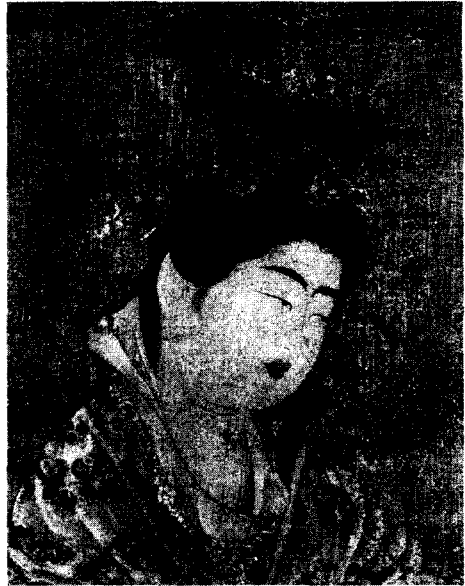
〈그림 14〉 圖13의 부분

거친 마포 위에 묘사되어 있는 길상천 26) 은, 옷자락이 바람에 날리고 양손을 뻗쳐 앞으로 하고 부드럽게 걷고 있는 자세를 취하고 있다. 풍만한 체구와 체구와 산뜻한 얼굴묘사는 불화로서 기품을 나타내