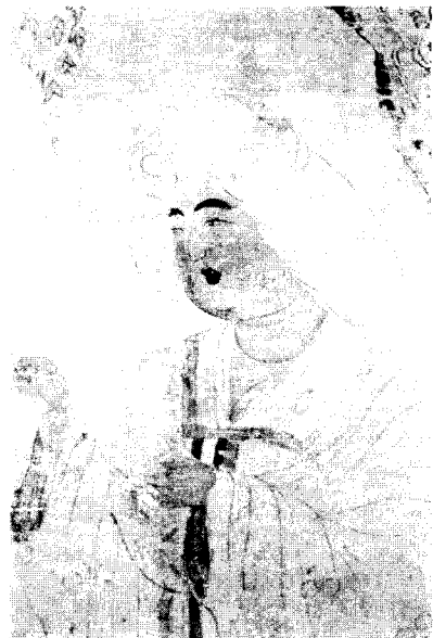
〈그림 8〉 圖 6의 부분

신체는 모두 풍만하게 표현되어 있으며 눈썹은 굵고, 눈은 가늘고 길며, 입술은 작고 붉으며, 뺨도 붉게 화장한 唐風여인의 모습이다. 눈썹, 눈, 입술의 선은 진한 농묵으로 그리고 있으나 이마와 머리와의 경계선, 턱선, 목선은 보다 부드러운 묵선으로 그리고 있어 한결 섬세한 느낌을 준다. 뿐만 아니라 이마, 턱 부분에 얇은 백색으로 채색효과를 주고 있는데 이 수법에 의하여 여인의 얼굴을 한결 우아하게 해주고 있다.(그림 8)