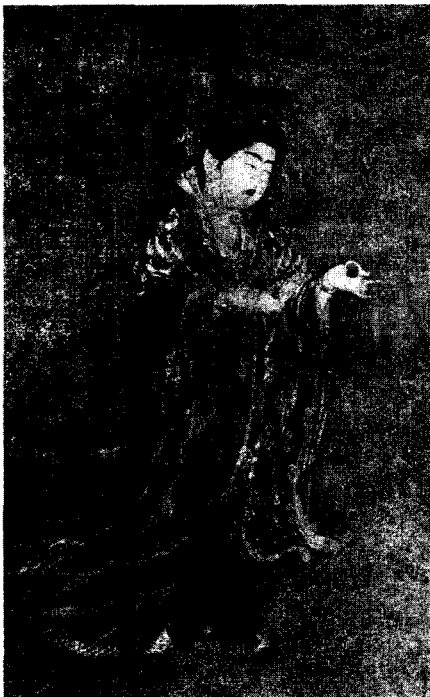
〈그림 13〉 藥師寺 吉祥天, 麻布着色, 53.3cm×32.0cm, 8세기, 奈良 藥師寺 (特別展 天平, 奈良國立博物館, 1998, 圖61)

이상 '실크로드의 종착점'이라고 흔히 이야기되는 쇼소인에 소장되어 있는 당풍의 鳥毛立女屏風에 관하여 살펴보았다. 이 고찰을 통하여 쇼소인의 鳥毛立女屏風이 중국의 것이던지, 일본의 것이던지 간에 쇼소인의 보물들이 당, 신라를 위시하여 이란, 페르