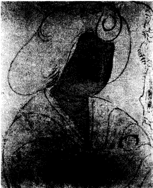
〈그림 7〉 조모입녀병풍 제4선 부분

이들 6선 중 가장 대표되는 2선, 즉 제3,4선을 중심으로 형식 및 양식적 특징에 관하여 간략히 살펴보면 다음과 같다. 6선의 형식은 모두 거의 흡사하여 여인의 좌측 혹은 우측의 뒷부분에 소나무라고 추정되는 老樹가 서있고 노수의 가지 끝에는 姘生