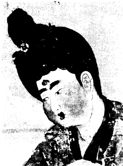
〈그림 9〉 唐仕女圖 얼굴부분, 唐(8세기), 絹, 전체 62.3× 54.2cm, 신강위그루자치구박물관(『中國文明展』, NHK, 2000, 圖113)

현재 屏風6扇에 잔존하는 鳥毛片은 매우 적고, 또한 극히 미세한 것이기 때문에, 원래 鳥毛의 貼成이 어느 정도의 범위까지 시행되었던가, 鳥毛의 貼裝은 어떠한 방법으로 되었는가하는 것은 명확하게 알 수 없다. 그러나 같은 시대 같은 수법으로 만들어진 쇼소인 北畠의 鳥毛篆書屏風에서 보이는 鳥毛貼成을 통하여 독특하고 깊이있는 색깔을 자아내었을 立女屏風의 당초의 양상과 그 방법을 다소나마 추측해 볼 수 있을 것이다.(圖 11,12) 그 결과 貼裝에 있어 목선의 선을 따라서는 작고 폭이 좁은 鳥毛를 붙이고, 그 안쪽에는 보다 폭이 넓은 鳥毛로 내부를 채웠을 것임을 알 수 있으며, 붙이는 방법에 있어서는 마치 물고기의 비늘처럼 조금씩 겹쳐서