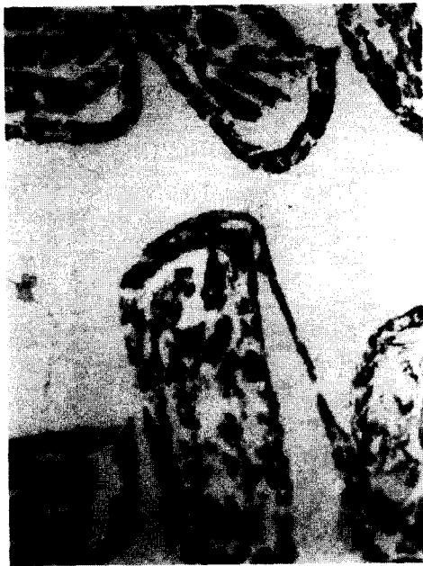
<그림 12> 圖 11의 부분