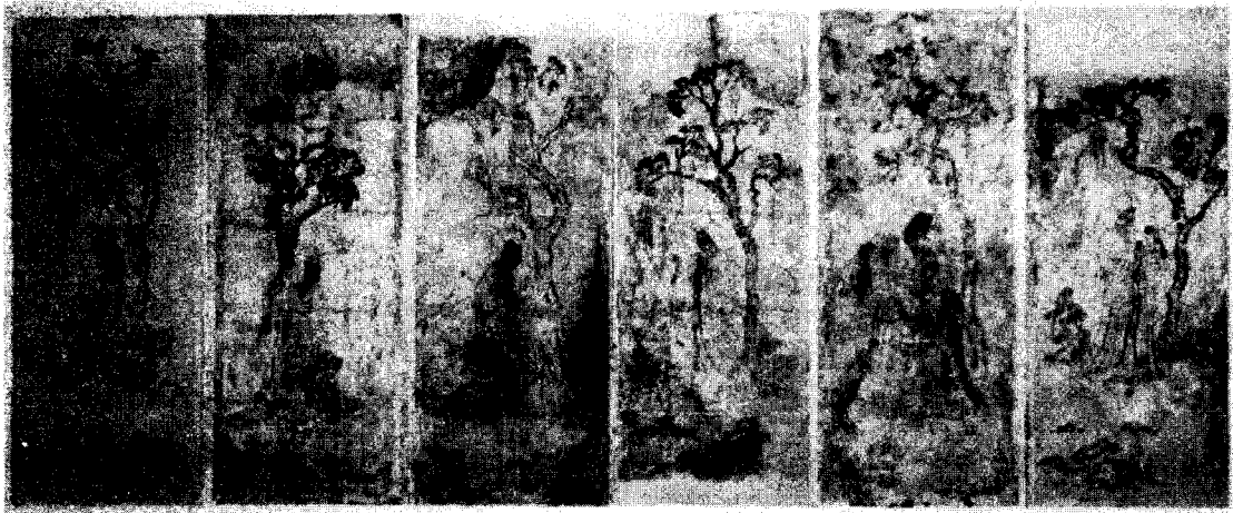
<그림 5> 鳥毛立女屏風, AD.725, 정창원(오른쪽부터 1扇)(『名寶 日本美術』, 正倉院, 小學館, 1983)

6선 모두 정도의 차이는 있지만 후세의 보필이 가해졌다. 원화의 보존상태는 제6선이 가장 나빠 여인의 얼굴 만이 原畫이고 그 외는 모두 補紙위에