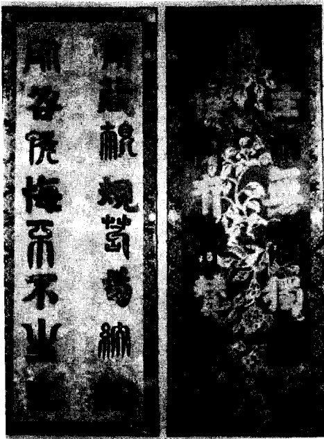
<그림 11> 鳥毛篆書屏風, 정창원 北倉 (『名寶 日本の美術』正倉院, 小學館, 1983)