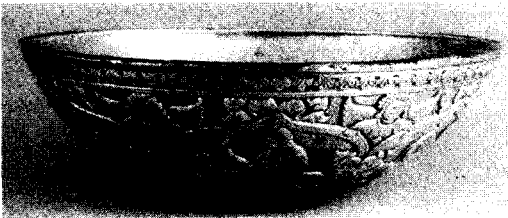
〈그림 2〉 銀器, 직경 18cm, 국립사마르칸드역사박물관 (『世界美術大全集 東洋編』, 15, 小學館, 圖167)

문자 그대로 나무 아래에 美人이 배치되어 있는 樹下美人圖의 기원에는 대체로 두가지 설이 있다. 하나를 이란 기원설이고 또 다른 하나는 인도 기원 설이다. 우선 이란기원설은 '多産, 豊饒의 상징인 大 地母神에 聖樹가 가해진 것에서 비롯되었다 7) '라는 것으로 포도나무나 포도 당초아래 서있는 아나히타 女神 8) 이 그것이다. B.C.4000년 이래 이란 고원에서 는 농경과 목축에 큰 영향을 미치는 기후와 계절이 그들 생활의 기본조건이었다. 특히 가뭄의 피해를 두려워하였던 사람들은 비의 원천인 하늘을 향하여 언제나 은총을 기원하였다. 하늘에는 비를 저장하는 大海가 있고, 하늘의 물을 쏟아 넣는 샘이 있다고 믿 어 이 샘을 '아르드비-스라-아나히타'라고 하였다. 9)