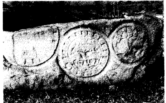
〈그림 4〉 樹下動物文 석재, 국립경주박물관

다음으로 인도기원설에 관하여 간략히 살펴보면 다음과 같다. 인도의 고대회화나 조각에 나타난 약 쉬니상과 마야부인의 모습을 형상화한 수하미인도 가 그것인데, 바르후트나 산치의 佛塔의 탑문에 표 현되어 있는 약쉬니상 10) (그림 3)과 佛傳圖 등에 있 는 마야부인의 부조상이 대표적인 예이다. 산치탑문 아래의 약쉬니상은 풍성하게 과실을 맺고 있는 망 고나무 아래 관능적으로 서있는 모습으로 표현되어 있고, 또 다른 계통인 마야부인의 상은 보리수아래 서 석가를 낳는 장면을 묘사한 것이다.