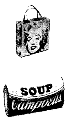
<그림 8> Philip Treacy 2003 F/W, www.philiptreacy.co.uk