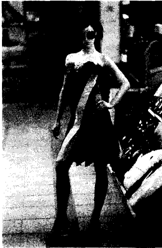
〈그림 2〉 Jean-Chales Castelbajac, 2000 S/S