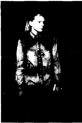
〈그림 9〉 Miguel Adrover, 2001 S/S