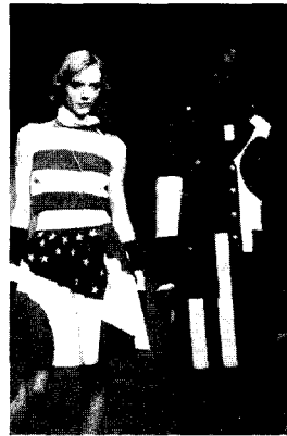
〈그림 11〉 Moschino Cheap & Chic 2001 F/W, www.firstview.com