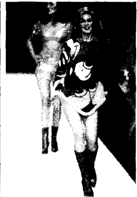
〈그림 12〉 Red or dead, 2000 S/S

Moschino 컬렉션에서는 단순히 디자인의 모티브로서 각 나라의 국기가 색상과 형태가 변형되어 폴라주형식으로 조합되었으며(〈그림 11〉) 이는 Viktor & Rolf나 Girls Rule 등의 컬렉션에서 미국 국기를 반복하여 프린트하여 디자인한 블라우스 디자인과 맥락을 같이한다고 볼 수 있다.