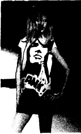
<그림 5> Jean-Charles Castelbajac, 2001 S/S, www.firstview.com