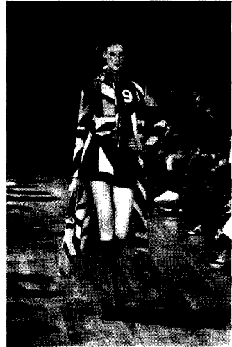
〈그림 4〉 Fake, 2001 F/W, www.firstview.com