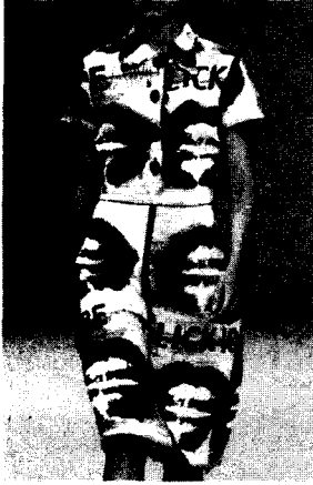
<그림 13> Paul Smith, 2003 S/S