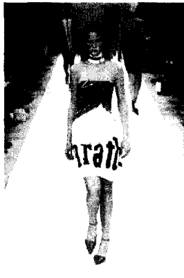
〈그림 10〉 Jean-Charles Castelbajac, 2002 S/S