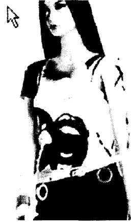
<그림 15> Miss Sixty, 2003 S/S, www.missixty.com