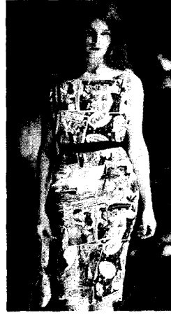
<그림 7> Dolce & Gabbana, 2004 S/S, "Fashion Show", 2004 S/S, p. 291.