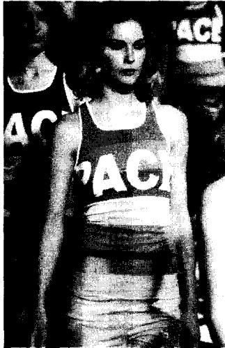
〈그림 3〉 D&G, 2003 F/W