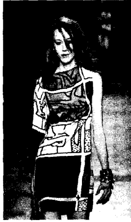
<그림 6> Jean-Charles Castelbajac, 2002 F/W