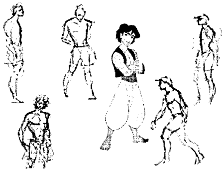
그림3)캐릭터 디자인을 하기 전 라이프 드로잉 5)

이렇게 다양한 포즈를 자유자재로 표현하는데 라이프 드로잉이야말로 필수적인 과정이다. 수많은 시간동안 모델이 취하는 다양한 포즈를 그림으로서 관절과 관절간의 관계와 가능한 동작등을 무의식적으로 습득하게 된다. 그것이 기본이 되어 보다 강하고 효과적인 포즈 또한 동작에 대한 기본적인 이해가 이루어진다.