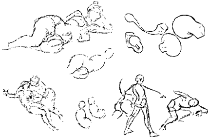
그림1)빌 푸의 드로잉 매뉴얼 3)

렇게 덩어리로 보는 연습을 함으로서 캐릭터 역시 단순한 2차원의 그림이 아닌 덩어리 형태인 입체로 볼 수 있다는 것이다.