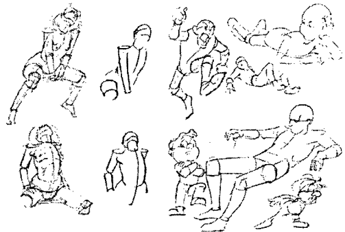
그림7)박스와 원통 구를 이용한 인체 구조들 4)