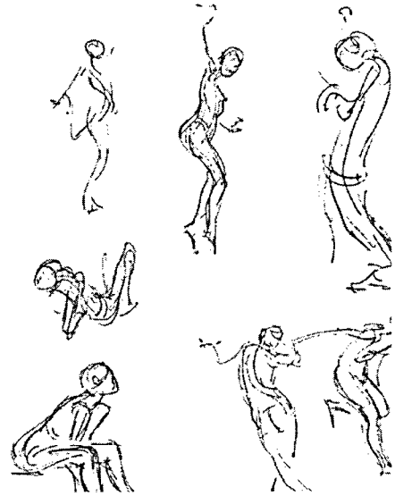
그림2) 빌 푸의 드로잉 매뉴얼 4)

만이 애니메이션의 생명인 과장된 액션을 효과적으로 보여줄 수 있다. 액션의 흐름이야말로 동작이 살아있음을 보여 줄 수 있는 가장 주요한 부분으로 애니메이션의 핵심이며 애니메이션 라이프 드로잉이 여타 기존의 순수 미술 중심의 라이프 드로잉과 크로키 등과 차별 되는 부분이기도 하다.