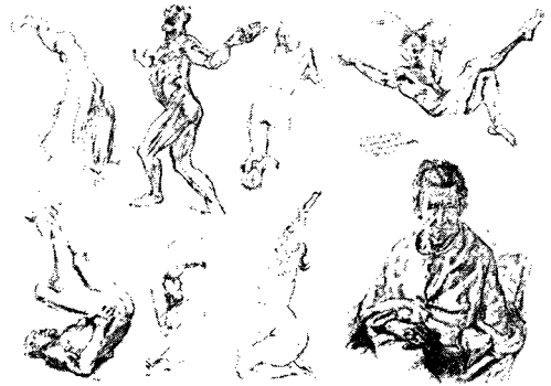
그림5) 리차드 윌리엄스의 라이프 드로잉 12)

사람은 본능적으로 보이는 대로 그리려고 한다. 하지만 그림의 생명력을 부여하는 애니메이터들에게는 그 이상의 것이 필요하다. 그 동작의 동세와 그 동작으로 인해 두드러진 인체의 특징을 파악하여 과장해 줌으로서 더 아름답고 살아 움직이는 듯한 느낌의 그림을 그려줄 때야말로 라이프 드로잉에서 원하는 바를 얻을 수 있다. 앞서 언급한 전통적인 기법에 애니메이션 기법 상 필요한 부분들을 보충하여 학생들에게 라이프 드로잉을 교육하여야 한다. 이에 디즈니 라이프 드로잉 강사인 빌 푸의 라이프 드로잉 교육 비디오와 캐플라노 칼리지 라이프 드로잉 교육과정과 등을 참고로 연구하여 애니메이션과 학생들을 위한 라이프 드로잉 교육방법을 다음과 같이 제시하여보았다.