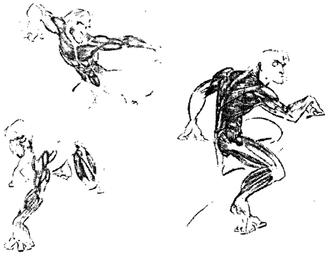
그림4) 디자인한 캐릭터의 해부도7)

는 캐릭터의 눈 부위의 근육이 어떻게 움직이는가? 입주변의 근육은 어떻게 올라가는가를 고려하여 만들기 때문에 일반인들이 생각하지 못한 곳에서 해부학은 영향력을 끼치고 있는 것이다.