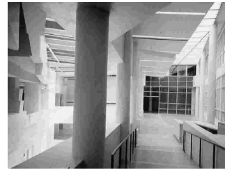
그림 6. 아르노프 디자인 센터, 피터아이젠만

의미강조 뒤에 약화되어 있는 것이다. 주로 시각적 파편의 요소들만이 그 텍스트적 상징성을 지원하여 명사적인 허공과 형용사적인 조망성이 결합하여 난해한 비일상적 수사학으로 그의 공간성이 표현되고 있다. 허공에 도입되는 자연 빛의 처리에 있어서도 집중시키지 않고 산개하는 형식을 통해 중심성 있고 고정적인 감정의 표현을 피하여 불확정성(indeterminacy)의 가변적 의미를 표현하고 있다.