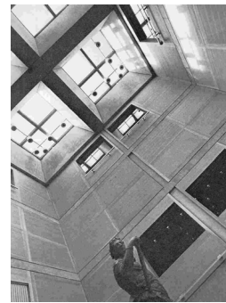
그림 3. 예일 대학 영국미술관 로비, 루이스 칸

으로 루이스 칸은 이들 간의 만남과 대화의 장으로서의 공간개념을 가장 존중한 것이다.