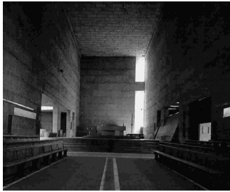
그림 5. 라 투레트 수도원, 르 꼬르뷔제