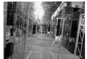
그림 2. 유리 비디오 갤러리, 버나드 츠미