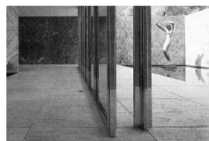
그림 1. 바르셀로나 파빌리온, 미스 반 데 로에

버나드 츠미(Bernard Tschumi, 1944-)는 미스 반 데 로에의 원칙적 근대주의사상을 전면적으로 해체하여 형태적 결과물에 있어서 큰 차이를 보이거나 조망성과 흐름에 중점을 두고 수동적 요소를 크게 배제 시킨 면에서 공통점을 보인다. 미스 반 데 로에의 안정적이며 결정적인(determinate) 프로그램이 버나드 츠미에게 와서는 불안정의 가치를 수용하는 비결정적(indeterminate)인 프로그램인 '이벤트(event)'로 바뀐 것일 뿐 외양적 가치와 힘에 의한 권력을 중시하는 생활양식에 의한 두 건축가 모두의 자존과 자신중심의 감정상태는 조망성과 흐름을 결합한 연속경관을 주제로 한 역동적인 공간으로 표현되고 있는 것이다. 유리 비디오 갤러리에서의 불안정한 경사판에 의한 흐름위주 내부공간과 전면유리에 의한 외부조망의 결합은 그의 이러한 성향을 나타내는 대표적인 사례이다.