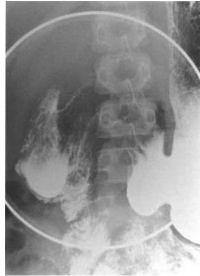
Fig. 3. Upper gastrointestinal series with barium reveals a round intraluminal lesion, filled with contrast medium and surrounded by a radiolucent halo in the second portion of the duodenum

도와 췌관의 촬영을 시행하지 못했다. 바륨을 이용한 상부 위장관 촬영상 정상적인 십이지장 내강과는 구분이 되면서 방사선이 투과되는 띠에 의해서 둘러싸인 큰 낭이 관찰되었다(그림 3). 십이지장 내강 내 계설이 의심되어 내시경적 절개술을 계획하고 실행에 옮겨 needle knife papillotome과 insulated tip(MTW Endoskopie, Germany)을 이용하여 계설의 정점을 절개하였다. 계설의 절개부위 가장자리에서 출혈이 있었으며 클립과 에피네프린을 투여하였으나 지혈이