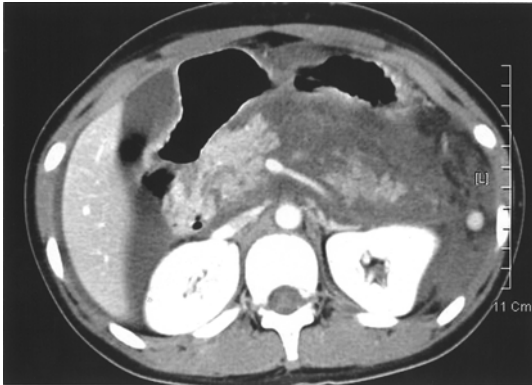
Fig. 1. Abdominal computed tomography (CT) scan suggests necrosis in 50 % of pancreas and peripancreatic fluid collection at the first attack of acute pancreatitis.