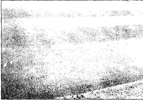
Fig 3. Kentucky bluegrass injury at 20 days after treatment to control creeping bentgrass of fenoxaprop-P-ethyl and triclopyr-TEA.

약제를 크리핑 벤트그래스 부분 발생지에만 부분적으로 처리한다면, 크리핑 벤트그래스가 제거된 공간을 자연스럽게 켄터키블루그래스가 채워나가게 되므로 크리핑 벤트그래스를 선택적으로 제거하는 데 매우 효과적인 방법으로 생각된다(Fig 3). 연구 결과는 보식을 할 경우에도 활용이 가능한데, 전술한 바와 같이 관리자는 실제 눈에 보이는 크리핑 벤트그래스만을 제거하므로 지상 포복경에 의한 재번식을 전혀 막지 못하나, 약제 살포 후 제거하면 지상 포복경에 의한 크리핑 벤트그래스 재번식 속도가 급격히 떨어지므로 보식 후 주위로 번지는 크리핑 벤트그래스 제거가 훨씬 수월해진다. 마지막으로, 잡초를 안전하게 효과적으로 방제하기 위해서는 방제시기가 매우 중요하므로, 향후 연구를 통해 추가 약제선발 뿐 아니라 적정 방제시기에 대한 종합적인 방제법이 마련된다면 국내의 골프장 관리자들에게 많은 도움이 될 것으로 기대된다.