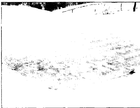
Fig 1. Creeping bentgrass invaded on Kentucky bluegrass tee.

그린에 조성된 크리핑 벤트그래스는 특별히 관리를 하지 않을 경우 그린칼라로 쉽게 퍼져 나가는데 많은 관리자들은 제초제를 처리하여 그린 칼라주위로 번지는 크리핑 벤트그래스를 방제하거나 좀 더 안전하게 크리핑 벤트그래스 지상포복경을 절단하는 방법을 사용하여 관리한다. 하지만, 켄터키 블루그래스에 크리핑 벤트그래스가 발생한다면 문제가 조금 심각해진다. 국내 대부분의 골프장 티는 켄터키 블루그래스로 조성되어 있으며, 최근에는 페어웨이가 켄터키 블루그래스로 조성된 골프장들도 증가하는 추세인데, 이는 한국잔디보다 품질이 우수하고 오랜 녹색기간을 유지할 수 있을 뿐 아니라(안 등, 1992; 심, 1996) 플레이어 입장에서 좀 더 정확하고 정교한 샷을 구사할 수 있다는 장점 때문에 최근 선호도가 점점 높아지고 있다. 하지만, 한지형 골프장에 대한 관리정보는 크게 부족한 상태인데 특히 페어웨이나 티가 켄터키 블루그래스로 조성된 골프장에 가 보면 누구나 쉽게 발견할 수 있는 부분이 바로 크리핑 벤트그래스에 의한 오염으로 이것은 골프장 전체의 미관을 크게 떨어뜨린다(Fig 1). 크리핑 벤트그래스가 침입한 원인은 다양한 추측이 가능하지만 종자에 의한 혼입이 가장 유력하