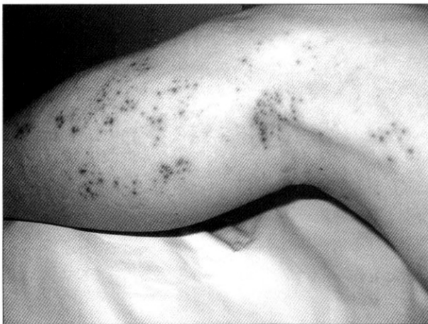
Fig. 1. Shingles (zoster). Involvement of the L5 dorsal root ganglia.

입원 이틀째 환자는 어지러움 및 두통이 지속되면서 수포를 동반한 홍반성 구진이 복부와 안면부 및 두피에 불규칙하게 발생하였다(Fig. 2). 이때 시행한 신경학적 검사에서 뇌막 자극징후나 안저의 이상소견은 발견되지 않았다. 요추부 자기공명영상에서 다발성 추간판 팽윤소견을 보였으며, 뇌 자기공명영상에서 연령증가에 따른 변화 외에는 특이소견 없었다. 근전도 검사에서도 비정상적인 소견은 관찰되지 않았다. 혈액도말 검사는 정상이었으며, 혈액을 이용한 바