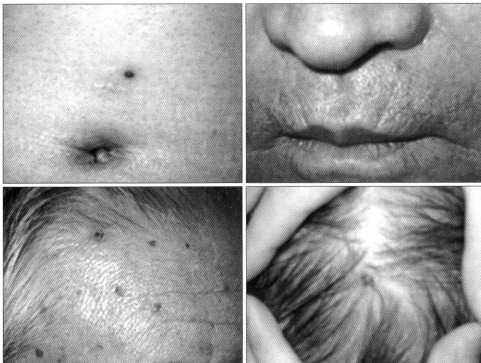
Fig. 2. Shingles (zoster). Lesions are shown in the multiple aberrant sites involving abdomen, face, scalp.