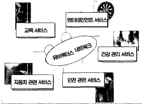
(그림 4) Far Future에서 제공될 유비쿼터스 응용 서비스

정부에서 추진하고 있는 u-정부 서비스를 홈네트워크와 연계하여 가정에서도 시간과 장소에 제약 없이 행정 서비스를 제공받을 수 있게 해야 할 것이다. 우선 제공 가능한 서비스를 단계적으로 시범 서비스하고 계속해서 확대해 나가야 하며, 이런 서비스를 활성화하기 위해서는 디지털 TV, 이동단말 등을 이용하여 서비스를 받을 수 있도록 정부차원에서의 셋톱박스 지원 및 적극적인 홍보가 이루어져야 할 것이다. 또한 u-정부 서비스를 원활하게 제공하기 위해서는 마이크로칩이 내장된 통합전자주민증을 도입하여 국민 개개인의 정보에 맞는 맞춤형 서비스를 제공해야 할 것이다. 통합전자주민증에는 의료보험카드, 신용카드, 현금카드, 여권, 운전면허증 등의 기능을 통합시켜 이 통합된 전자주민증 하나만 가지고 여러 가지 서비스를 제공받을 수 있게 해야 할 것이다. 하지만 통합전자주민증 추진에 작용하는 걸림돌이 존재하는데, 가장 핵심적 논란거리는 바로 정보독점과 정보유출이라고 할 수 있다. 전자적 감사·통제로 인한 ‘빅브라더’ 논쟁은 피할 수 없으며, 나아가 개인정보 유출에 따른 사생활 침해 등 심각한 폐해가 우려된다. 따라서 최소한의 사회적·국민적 합의점을 반드시 이끌어내야 하며, 이를 위해 충분한 기술 연구개발 및 검토를 통한 보완책을 마련하고 공론화를 통한 국민적 여론을 수렴해야 할 것이다. 또한 완벽한 미래 u-정부 구현을 위한 최적의 정책 선택 등 철저한 사전준비가 이루어져야 하며, u-정부를 통해 업무 효율성과 대국민 서