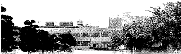
성서공장 주소: (704-900) 대구광역시 달서구 갈산동 358-80 TEL: (053)580-2500 FAX: (053)582-3389

주/푸드웰은 나라가 가난의 질곡에서 벗어 나려고 몸부림치던 시기인 1968년도 7월 선진농촌개발에 보탬이 되겠다는 취지로 대구광역시 동구 방촌동에서 “협성농산주식회사”로 출발하여, 지난 38여 년간 국내 농산물 가공 분야의 선두 주자로서 착실히 기반을 다지며 성장하였고 수출 물량의 비중이 높은 그 당시에는 국내보다는 일본을 위시한 해외시장에서 더욱 인정을 받아 왔습니다.