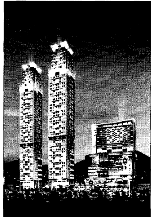
부산은천동 HUB SKY

자의 무리하거나 과도한 요구를 정당하게 거절할 수 있어 불필요한 분쟁을 제거할 수 있다고 본다.