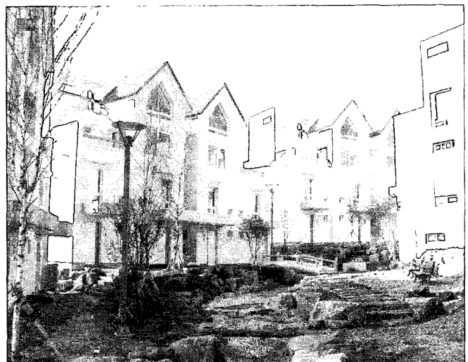
민들레 영토 평창리조트.

지금까지는 임직원의 인적 Network을 통하여 수주를 하여 용역을 수행하여 왔으므로 체계적인 조직이나 인력의 중요성이 다소 덜하였으나, 향후 CM사업에 본격적으로 진출 하기