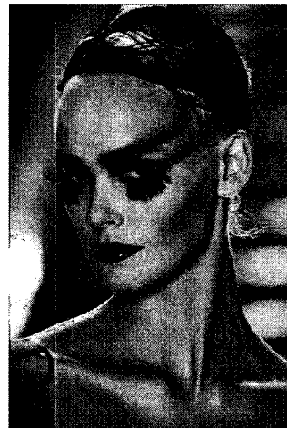
〈그림 2〉 회화적 메이크업 John Galiano 2003 S/S, 「www.style.com」

편적인 목적 뿐 아니라 개인의 이미지와 의상과의 동질성을 표현하기 위한 커뮤니케이션의 한 방식을 보여주는데 있다. 현대의 메이크업은 20세기 후반 이후의 예술 전반에 표현되는 표현의 무제한성에 따라 기존의 전통적인 미의식에서 벗어난 자유롭고 주관적인 개성표현에 의한 다양성의 미적가치를 표현하고 있다. 회화에서 사용하는 색채와 질감으로 의상의 분위기를 돋보이게 하고 있으며(그림 2) 메이크업과 조화되는 헤어스타일과 헤어 액세서리는 고도의 토탈 코디네이션을 표현하고 있다.