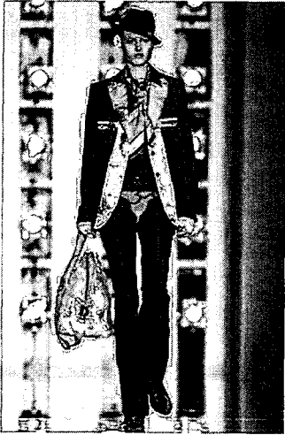
〈그림 7〉 기본구성방법이 파괴된 테일러드 재킷, Christian Dior, Fall 2001 Ready-to-Wear, 「www.style.com」

괴하거나 황폐화 시키는 것이 아닌 해체복식이론의 성립 근거를 마련하였다. 36)