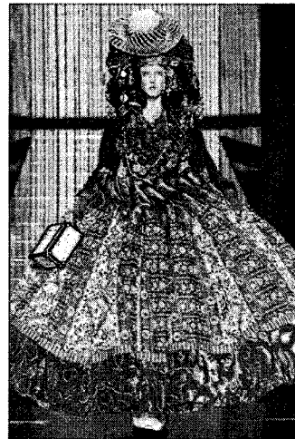
〈그림 12〉 과잉장식을 통한 극적인 효과, John Galliano, Fall 2004, Ready-to-Wear

그가 사용하는 대담한 장식은 인체에 꼭 맞는 글래머러스한 패션에 상승작용을 하여 화려하게 디자인을 완성시킨다. 이러한 장식은 시대를 초월한 미