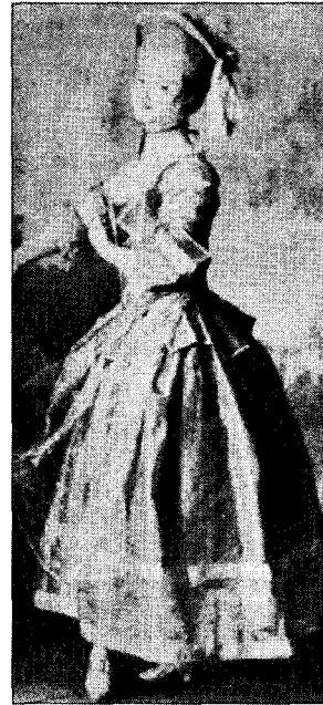
〈그림 3〉 낭만주의 복식 20000 years of fashion. ABRAMS, p. 327.

그의 의상에서 동화속의 공주 21) 로 표현되며 낭만주의의 에로티시즘을 바탕으로 하여 유혹적인 패션의 재창조를 한다.