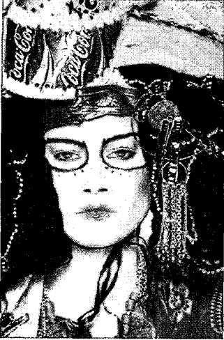
〈그림 9〉 페이스 페인팅, John Galliano, Fall 2004 Ready-to-Wear

그러나 존 갈리아노가 패션쇼를 통해서 보여주는 메이크업과 헤어스타일은 획일적인 미의식에 도전하는 다양한 방식의 미의식이 반영된 아방가르드 예술의 양식을 보여준다. 그것은 여성적인 미의 기준이 아니라 변형의 원리를 이용하여 메이크업과 헤어스타일을 극대화하여 표현함으로써 의상의 패션 이미지를 극대화시키고 새로운 충격효과를 얻어낸다. 즉, 패션의 요소를 빛내주기 위한 보조적인 존재이며 아름다움과 섹시함을 부각시키기 위한 기본 역할 48) 뿐 아니라 독립적인 예술로서 독특한 의상 표현에 어울리는 개성표현과 다양성과 극한적 경향을 가지고 의상과 조화를 이루고 있다. 따라서 그의 메이크업과 헤어스타일 표현은 자유와 독립성을 드러내는 독립적인 예술로서의 역할을 감당함과 동시에 불완전한 얼굴의 교정이라는 일반적인 의미의 뷰티 메이크업보다는 그의 의상 컨셉과 표현하고자 하는 이미지를 극대화하기 위해서 표현된다. 그는 바디페인팅이나 페이스페인팅(그림 9)의 시도를 통해서 새로운 미학을 표현하고 있으며 이러한 새로운 방식은 다른 디자이너의 패션쇼나 패션잡지, 광