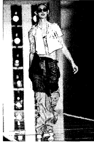
〈그림 14〉 비정형적 스타일의 해체된 소매, John Galliano, Spring 2002 Ready-to-Wear

그의 실험적 착장방법은 통합적인 조형미를 나타내면서 하나의 디자인요소를 과장하거나 파괴하는 특징을 가진다. 이 특징은 다시 환상적이면서 아방