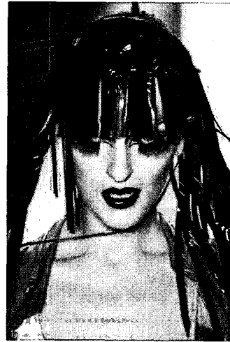
〈그림 10〉 극대화된 헤어스타일, John Galliano, 2003 S/S, 「www.style.com」

고모델들의 메이크업 표현에서도 점점 확산되어가는 경향을 보여주고 있다. 디자이너의 카리스마와 철학을 표현하고 있는 그의 패션쇼는 창작의 모티브를 제공하고 있다. 새롭고 파격적인 것을 추구하는 소비자와 디자이너의 무한한 표현의 욕구가 지속되는 한 헤어스타일과 메이크업에 의한 이미지의 극대화는 더욱 확산 될 것이다(그림 10).