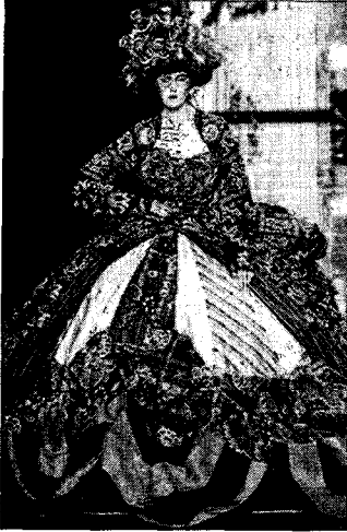
〈그림 4〉 재현적 낭만주의 복식 John Galliano, Fall 2004 Ready-to-wear, 「www.style.com」