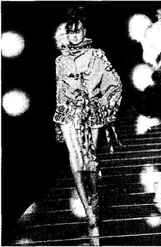
<그림 6> 다문화적 복식, John Galliano, 2002 F/W

게 하기위한 중요한 수단이 되고 있다. 이것은 창조적인 외적 표현 수단만이 아니라 정신적 사고의 공간을 가지고 과거에의 동경이 현대적 감성에 일치되는 조화로서 나타난다. 갈리아노에 의하여 현대디자인으로 재구성한 과거의 양식을 통하여 유희와 안락함과 환상을 제공한다(그림 6).