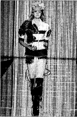
〈그림 8〉 이소재의 결합을 통한 창조성, John Galliano, Spring 2005 Ready-to-Wear

중요성이 강조되고 있다. 다채로워진 소재에서 표출되는 이미지는 디자인의 영감을 불러일으키는 요소가 된다. 소재에 있어서 고상함과 악취미의 결합을 통하여 그는 창조성을 개발한다(그림 8).