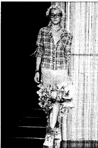
〈그림 11〉 테일러드 재킷과 러플의 결합, John Galliano, Spring 2004, Ready-to-Wear, 「www.style.com」

곡선이 풍부한 호화로움, 감각적인 기교성을 보여주어 시대미를 표현하는 중요한 역할을 하였고 바로크의 위엄과 장려함을 표현하기 위하여 레이스, 루프, 테슬, 프릴, 플라운스, 프린지, 러플등을 사용하였다(그림 11). 갈리아노는 스모킹, 쉬어링, 터크, 플리츠, 레이스, 플라운스, 애플리케, 자수, 리본 등의 장식 과 장식성 소재 표현을 통해서 화려하고 우아한 환상적 미를 제공한다. 레이스, 주름장식, 꽃, 깃털로 꾸며진 모자나 장신구, 털 부채, 뒤축이 없는 물 등은 패션이미지에 긴장감을 주며 그가 표현하는 파라솔, 손수건, 백, 에이프런 등은 실용성보다는 장식성이 매우강하고, 그가 표현하는 과잉장식은 화려하고 동적인 느낌을 준다(그림 12). 이런 장식적 요소들은 극적인 효과를 나타내어 작품들을 독특한 현대적인 모습으로 보이게 한다. 장식에 의한 효과는 디테일 및 트리밍의 사용에서 한층 돋보이고 있으며 복식조형의 한 요소가 되는 화려한 장식은 호화로움을 통해서 소비자의 미적요구를 충족시키고 있는 것이다.