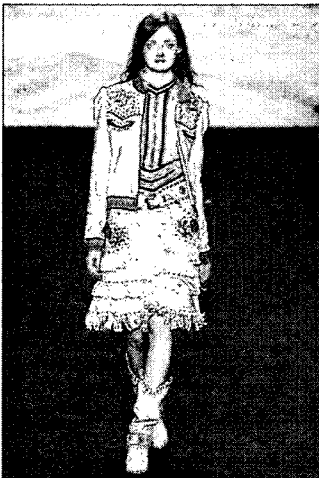
〈그림 1〉 비즈를 단 의상 Anna Sui Spring 2005 Ready-to-Wear

1970년 이래 유행이 되고 있는 에스닉 패션과 네오히피 패션에서 표현되고 있는 고급스러운 비즈(beads), 스팅글(spangles)과 세퀸(sequins)은 다양한 크기와 색깔로 평범한 의상에 개성과 고급스러움, 화려함을 더해주는 역할을 한다(그림 1).