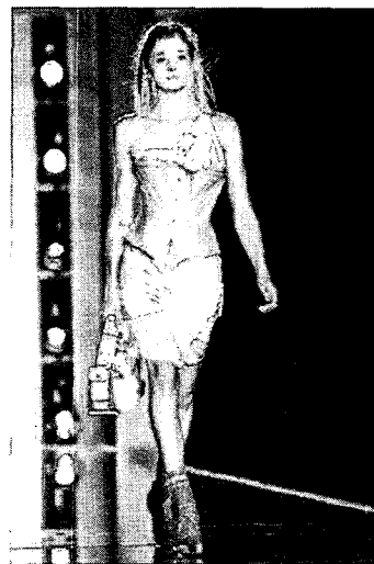
〈그림 5〉 복고적 복식 John Galliano, Spring 2002 Ready-to-Wear, 「www.style.com」

갈리아노는 이미지의 차용을 아이로닉한 패러디 31) 에 의하여 구성하고 있으며 과거의 친숙한 요소를 여성적이면서도 충격적이고 드라마틱하게 표현하고 있다. 갈리아노의 역사·문화주의는 과거에 대한 역사적 내용의 재현이 아니라 이미지를 차용함으로써 현대패션의 정서와 시대상에 맞게 새로운 양식으로 표현되고 있다(그림 5). 갈리아노에게 있어서 역사·문화주의는 그의 표현력 창출을 자유롭게