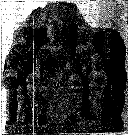
〈그림 6〉 불좌상, 탁실라박물관(필자 사진)

간다라의 편단우견 불상은 페샤와르 박물관 불좌상(그림 9,10)이 대표적인데, 이들은 대부분 전법륜인을 취하고 있으며, 편단우견 불의의 자락 이외에도 가슴을 덮는 승각기가 선명하게 표현되어 있다.