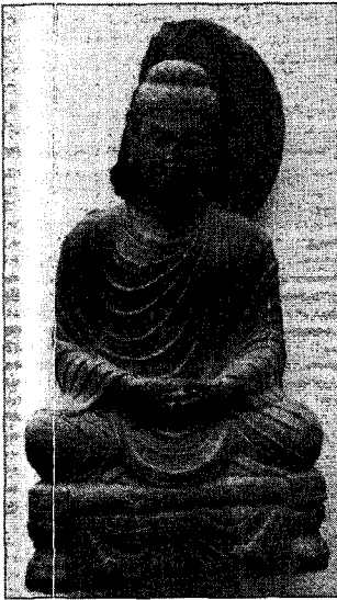
〈그림 7〉 불좌상, 스와트박물관