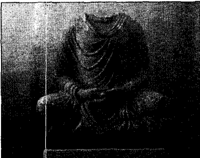
〈그림 8〉 불좌상, 탁실라박물관

간다라 불상의 불의는 마투라 불상에 비해 천의 두께가 두껍게 표현되어 있을 뿐만 아니라 대부분이 통견의 형식을 취하고 있다. 이처럼 간다라 불상의 불의가 대부분 통견 형식을 취하고 있는 점에 관해서는 간다라 지방이 추운 지방이기 때문에 보온의 효과를 높이기 위해서 이러한 형식을 취했다