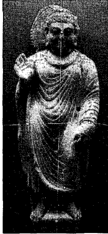
〈그림 12〉 불입상, 스왓박물관

간다라 불상의 불의는 페샤와르(Peshawar), 탁실라(Taxila), 스왓(Swat) 등 지역에 따른 양상이 뚜렷이 나타나지 않는다. 26) 탁실라지역 불상은 옷주름이 부드럽고 자연스런 옷주름이 특징적이고, (그림 8) 스왓지역 불상은 불의주름이 형식화된 것처럼 보여(그림 12) 일견 각 지역 양식에 차이가 있는 것으로 생각할 수도 있다. 그러나 이러한 차이는 제작시기의 차이에 불과할 뿐이며, 실제로 같은 시기에 동일재료로 제작된 불상의 불의는 크게 차이가 없다. 탁실라의 불상은 대부분이 스투코여서 전체적으로 부드러운 느낌을 주지만, 이들의 제작시기는 4세기 이후로 비교적 늦다. 스왓의 경우도 이른 시기의 단독불상은 거의 찾아볼 수 없고, 남겨져 있는 단독불상은 4~5세기 경에 제작된 것들이어서 페샤와르, 라호르박물관의 초기 석불조각의 불의와는 차이를 보일 수 밖에 없는 것이다.