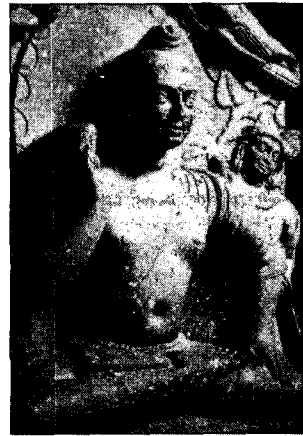
〈그림 13〉 마투라 불좌상 (中村 元, 金知見 譯, 『佛陀의 世界』, 김영사, 1984, 圖 4-43)

고,上衣와 下裙만 입고 있는 점도 특징적이다. 재료는 짐작컨대 아주 얇은 모슬린 종류였을 것이며, 그 크기는 상의가 2m×6m, 하의는 1m×2m 정도였을 것으로 생각된다. 같은 쿠산시대 아마라바티(Amaravati)나 나가르주나콘다(Nagarjunakonda)의 불상도 편단우견으로서 마투라식의 불의를 따르고 있으나 立像인 경우 굴곡주름이 없다는 점에서 차이를 보인다.