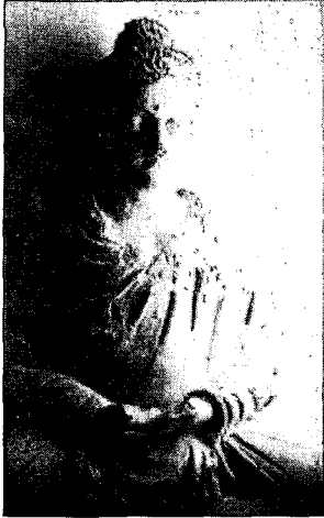
〈그림 11〉 불좌상, 탁실라박물관

는 주장과 그리스 헬레니즘의 영향으로 그와 유사한 형태를 취하였다는 주장이 있다. 25)