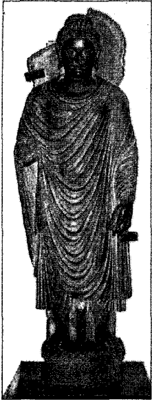
〈그림 3〉 불입상, 페샤와르박물관

상과 마찬가지로 통견형식이 많지만 오른쪽 어깨만을 드러내 입는 편단우견 형식도 적지 않게 보인다.