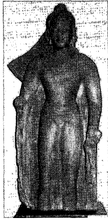
〈그림 15〉 사르나트 굽타불입상, 사르나트박물관

허벅지와 무릎에 생긴 불의주름은 옷 무게에 의해서 생긴 것이며, 바로 중국의 비단으로 만들었기 때문이라는 주장이 있다. 29) 그러나 비단을 만들기 위해서는 많은 누에의 살생이 필요한데, 과연 중앙아시아나 중국의 승려들이 불의를 실크로 만들었을 것인가 하는 의문이 든다.