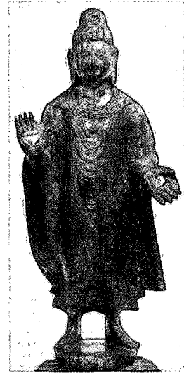
〈그림 16〉 太平眞君4年(443), H.53.2cm, 북위, 일본 개인소장(『アレクサンドロス大王と東西文明の交流展』, 2003, 圖 168)

허벅지와 무릎에 생긴 불의주름은 옷 무게에 의해서 생긴 것이며, 바로 중국의 비단으로 만들었기 때문이라는 주장이 있다. 29) 그러나 비단을 만들기 위해서는 많은 누에의 살생이 필요한데, 과연 중앙아시아나 중국의 승려들이 불의를 실크로 만들었을 것인가 하는 의문이 든다.