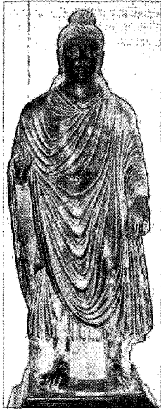
〈그림 4〉 불입상, 페샤와르박물관