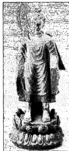
〈그림 18〉 阿育王석입상, 太淸5年(551), 1955년 사천성 성도시 서안로출토, 사암, H.48cm, 사천성 성도시 문물고고연구소(『中國文明展』, NHK, 2000, 圖 100)

간다라 및 서역의 영향을 강하게 보이는 불상의 계열과는 달리 효문제(孝文帝 471~499)이후 漢化정책 이후 중국화된 불의형식이 새롭게 출현한다. 이러한 형식의 유행은 6세기대에 두드러지는데, 이 중국식 불의는 통견불의 형식에서 옷자락을 왼쪽 어깨 뒤로 넘기던 것을 넘기지 않고 왼쪽 팔 위에 걸치는 형식이다. 다시 말하면 오른쪽 등쪽에서 오른쪽 어깨를 지나 가슴을 가로질러 왼쪽 어깨로 넘