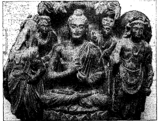
〈그림 9〉 불삼존상, 페샤와르박물관

간다라의 편단우견 불상은 페샤와르 박물관 불좌상(그림 9,10)이 대표적인데, 이들은 대부분 전법륜인을 취하고 있으며, 편단우견 불의의 자락 이외에도 가슴을 덮는 승각기가 선명하게 표현되어 있다.