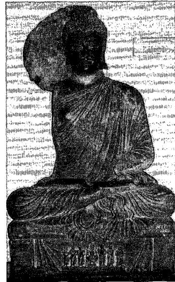
〈그림 10〉 불좌상, 페샤와르박물관