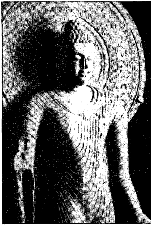
〈그림 14〉 마투라 굽타불입상 (中村 元, 金知見 譯, 『佛陀의 世界』, 김영사, 1984, 圖 6-10)