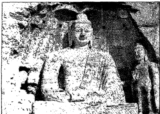
〈그림 17〉 운강석굴 제20굴(『世界美術大全集』 東洋編 第3卷, 2002)

라고 부르기도 한다. 이 같은 형식은 간다라나 마투라에서는 전혀 보이지 않는 중국적인 것이라 할 수 있는데 어떤 이유에서 그러한 착의법이 만들어지게 되었던 간에 현실적인 의복형태로 보이지 않는다. 이는 아마도 전형적인 편단우견식 불의가 중국인의 구미에 잘 맞지 않았기 때문이었을 것이다. 32)