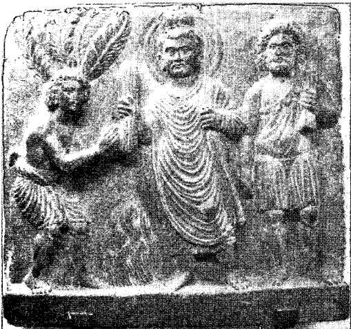
〈그림 5〉 金剛座에 깔 짚을 받는 붓다, H.39cm, 페샤와르박물관

간다라불상의 경우 입상은 모두 통견식 불의를 입고 있다.(그림 3,4,5) 대부분 오른손은 시무외인을