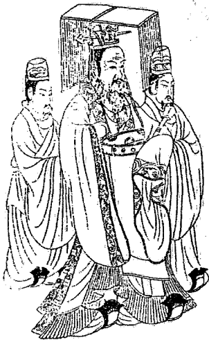
〈도 2〉 엽립본의 隋문제의 면류관모 착용도, 위의 책, 42.

* 이상 10복의 면류는 모두 12류이고, 의의 영표는 모두 승룡(昇龍)을 자수한다. 또 제복의 경우는 필(鞞)에 용·화·산의 3장을 장식하고 채사로서 잔다. 수는 창(蒼)·청(靑)·주(朱)·백(白)·황(黃)·현(玄)·훈(緋)·홍(紅)·자(紫)·추(緋)·벽(碧)·녹(綠)의 12색의 조(組)였다.