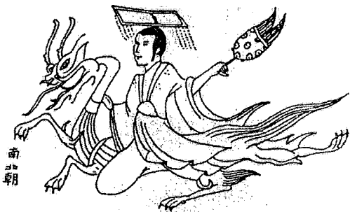
<도 5> 오희분 5호묘 면류관모 착용도, 조선화보사, (1987), 고구려벽화, 도판 220

5호묘 76) 의 서북면에 용을 타고 승천하는 선인은 홍색의 모자끈이 달린, 황색의 면류관을 쓰고 있다. 면류는 6개씩 짝어, 전면에 4류, 후면에 4류이고, 천청색의 衣, 좌우 양어깨에는 별문으로 생각되는 별이 3개씩 그려져 있다. 천청색 의에는 홍색으로 단처리를 하였다. 홍색 폐슬을 두르고, 오른손으로 용의 목을 잡고, 왼손에는 깃털 부채를 쥐고 있다.<도 5>