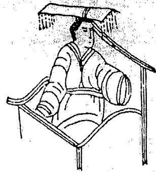
<도 1> 복위 사마금용묘 면류관묘 착용도, 주석보, (1983)

희평 2년(517)에는, 한대의 복색제에 준하여 입교제사에 의·책의 복색을 각 방위색과 같이 하였고 희평(516-518) 9년, 명제가 거복제를 정하였다. 복위의 복제는 한, 위의 제도를 답습한 것이었다. 56)