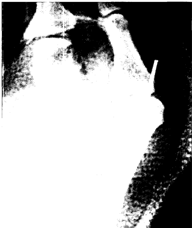
Fig. 3. In the postoperative view, metacarpophalangeal joint of thumb was fixed with K-wire.

관절경 소견상 전예에서 무지 중수 수지 척측 측부 인대의 완전 파열이 관찰되었다. 그 중 5예에서 Stener 병변이 관찰되어, 완전 파열 중 39.2%에서 존재하였다. 평균 수술시간은 51분(34~62분)이었고, 수술시간은 술자의 경험이 증가함에 따라 점차적으로 감소되었다. 통증의 정도는 수술 후 초기에는 통증을 호소하였으나, 이후 2~3개월 이내에 감소하는 양상을 보였으며, 추시 소견상 11예에서는 통증이 완전 소실되었고 2예에서 물건을 집을 때 가끔 경한 정도의 통증을 호소하였으나 일상생활에 지장을 주지는 않았다. 관절의 안정성은 스트레스 방사선 사진 촬영상, 12예에서 견측과 비교하여 5도 이내의 안정된 소견을 보였고, 1예에서 8도의 경한 불안정 소견을 보였으나 기능상의 불안정성은 호소하지 않았다(Fig. 4). 무지 중수 수지 관절의 운동 범위는 평균 운동 범위가 52도(47~56도)로 견측의 운동 범위와 거의 같은 정도의 범위를 보였다. 무지의 집계력은 평균 17 Kg(15~20 Kg)이었으며 정상측과 비교하여 평균 92%로 회복되었고, 파악력은 평균 42 Kg(39~48 Kg)으로 정상측과 비교상 평균 94%정도로 회복