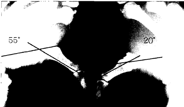
Fig. 1. In the stress view, acute complete rupture of ulnar collateral ligament at metacarpophalangeal joint of thumb was shown.

대상으로 하였다(Fig. 1). 수상 당시의 평균 연령은 35.6세(21~46세)였으며, 손상 원인인 스포츠로는 스키7예, 축구3예, 테니스2예, 유도1예이었으며, 이중 남자는 9명, 여자는 4명이었다. 좌측 무지 중수 수지 관절 손상은 3예, 우측 무지 중수 수지 관절 손상은 10예였다. 수상 2주 이내 관절경적 진단 및 치료를 시행하였고 추시기간은 평균 16.4개월(12~24개월)이었다.