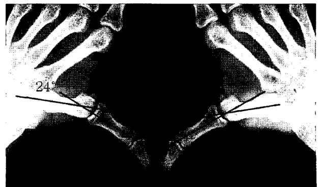
Fig. 4. Stress X-ray at 1year fallow-up was checked the 24° metacarpophalangeal joint radial deviation in lesion side comparing with 20° radial deviation in normal thumb.

그러나 척측 측부 인대의 완전 파열 및 Stener 병변을 진단하기 위한 방법으로는 이학적 검사 중 스트레스 검사나 스트레스 방사선 검사를 시행할 수 있으나, Louis 등 10) 은 스트레스