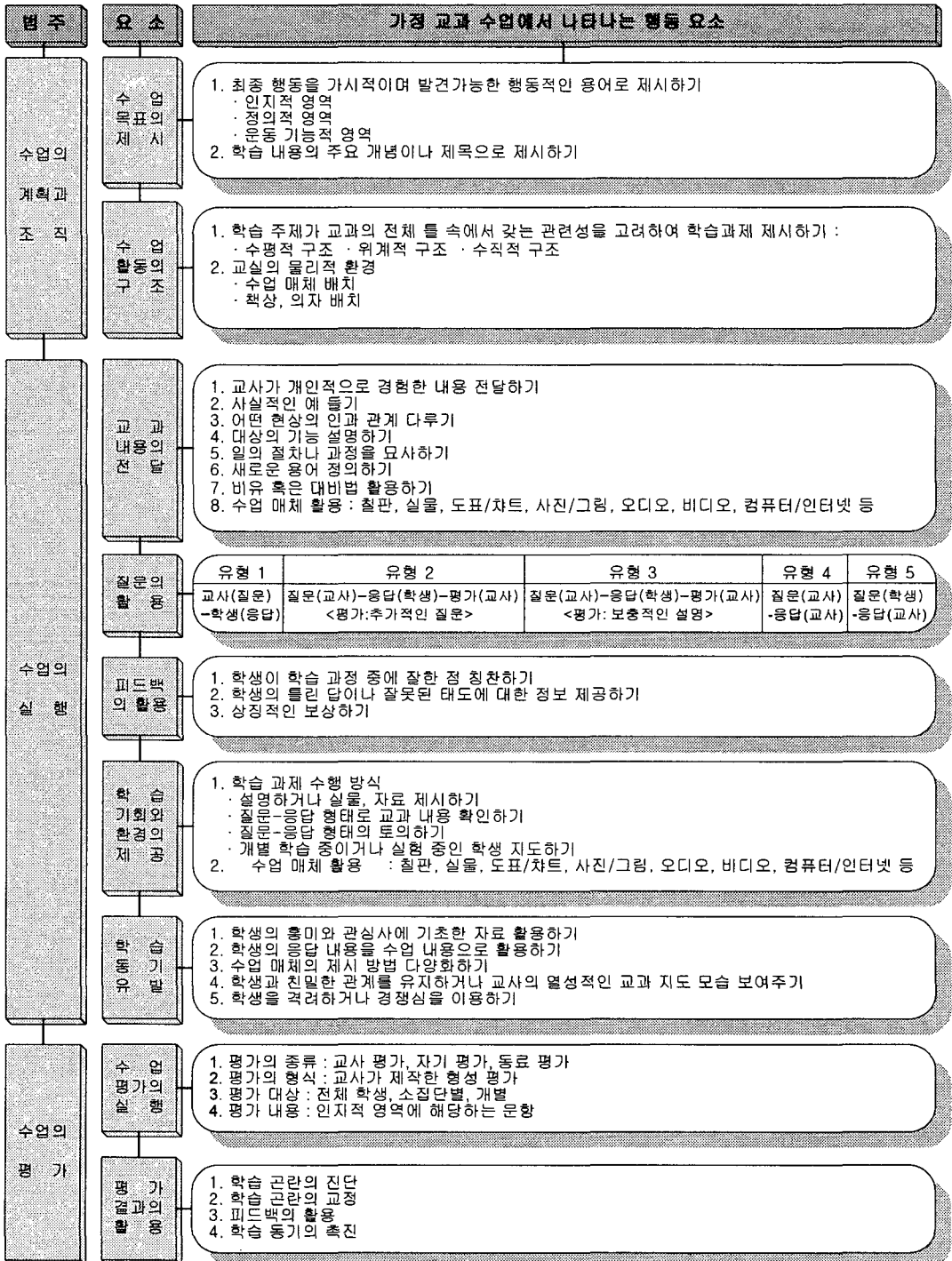
[그림 N-1] 가정 교과 수업 분석 틀