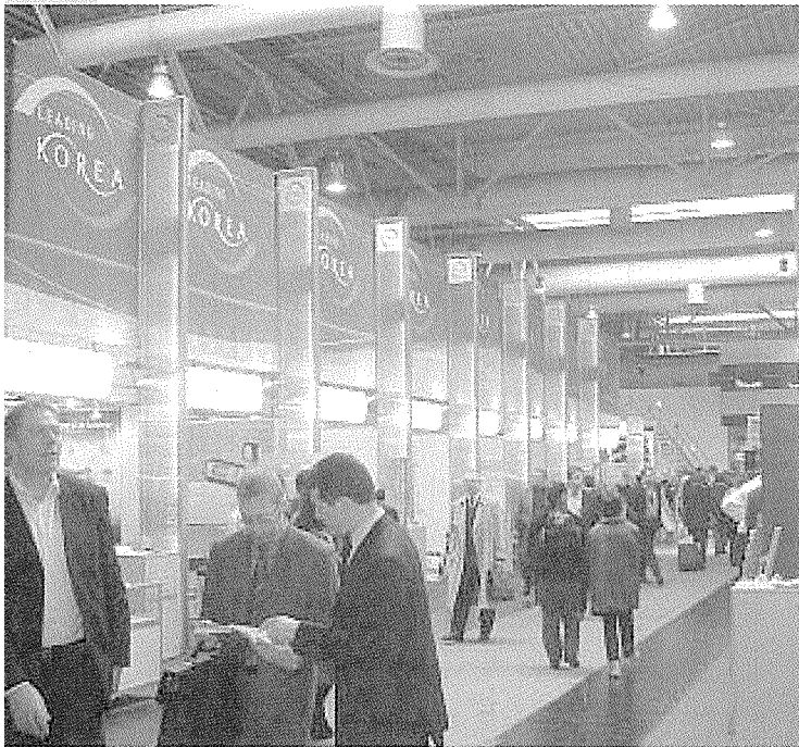
▲ [한국공동관 모습]

수 있는 '개인형 라디오'로 서비스료는 월 10~15유로로 예상되며, 음악뿐만 아니라 음성뉴스도 수신하고 음질은 FM라디오 수준이다.