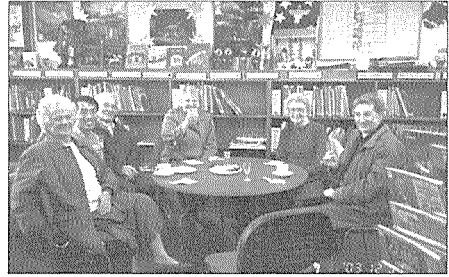
도서관 이용자 혹은 지역주민들이 셰필드 Frecheville 도서관에서 사서들과 자원봉사자들이 마련한 연말 특별 커피모닝(coffee morning)에 참석하여 열람실에서 커피와 음료수를 마시며 이야기를 나누는 모습 (2003년 12월, 왼쪽에서 두 번째가 필자).