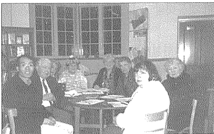
Walkley 도서관의 '도서관의 친구' 그룹의 임원과 회원들이 사서와 정기회의를 하고 있는 모습(2004년 2월). 이러한 모임을 통해서 '도서관의 친구'는 사서로부터 현재 도서관이 어떻게 운영되고 또 도서관에 어떤 어려움이 있는지 듣는다. 이러한 대화를 통해 '도서관의 친구'와 사서는 도서관이 당면한 문제점들을 어떻게 해결할 것인가를 진지하게 상의한다.

끝으로 필자는 '도서관의 친구' (Friends of the Library) 회원으로 주로 활동하고 있는 할머니 할아버지들이 도서관의 열람실 의자에 앉아 커피를 마시며 즐겁게 대화를 나누고, 집으로 돌아갈 때는 한아름 책을 빌려가는 모습 그리고 '도서관의 친구' 그룹이 커피 등을 팔아 모은 기금을 모아 도서관을 위해 어떻게 쓸 것인가를 사서와 상의하는 모습이 우리나라의 도서관에서 펼쳐지는 모습을 상상해 본다.