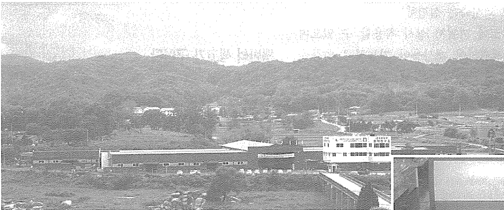
코리아닷컴 포천공장 전경