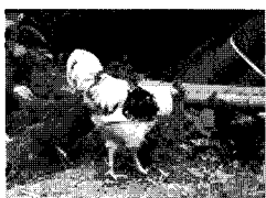
▲ 대밭 닭

서울을 비롯한 도시의 탁한 공기에 찌들어서 지내 온 도시민에게 대나무 숲에서의 죽림욕을 추천한다. 대나무 숯 찜질방은 고온, 중온, 저온으로 나뉘어 있어 선택의 즐거움을 맛 볼 수 있으며 대나무 숯 찜질방이 다른 찜질방과 다른 점은 땀이 흘러도 끈적거리지 않고 상쾌한데 있다고 한다.