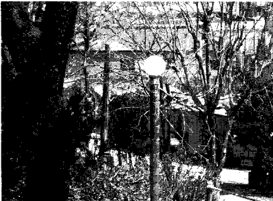
▲ 대나무기둥으로 된 가로등

있는데 이 식당에서는 대밭고을 도농교류농장에서 생산되는 죽순, 대밭 닭, 대밭 염소, 유정란을 비롯한 각종 산채를 재료로 대밭고을만의 독특한 향토 음식을 제공하고 있으며, 비봉래 팜스테이 농가에서 생산되는 딸기, 배, 쌀, 고추 등 농산물의 직거래장으로서 역할도 하고 있다.