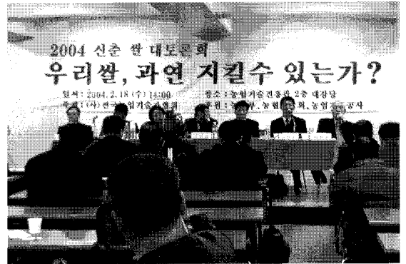
▲ 2004년 신춘 쌀 대토론회 장면