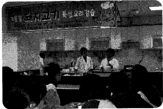
▲ 주부를 대상으로 실시하고 있는 돼지고기 요리강습회 장면