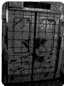
● 2003년에 시행되었던 지하철을 이용한 돼지고기 테마열차