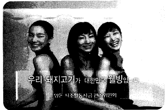
▲ 2004년 방송되고 있는 '웰빙삼총사' TV광고 장면