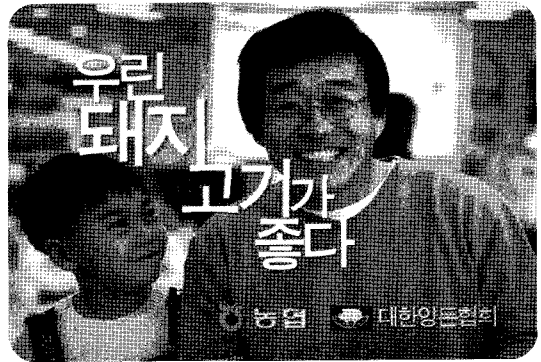
▲ 2002년 방송되었던 돼지고기 소비촉진 TV광고 장면

소비홍보 내용 역시 돼지고기의 영양적, 건강적 특징을 충분히 부각시킬 수 있는(예컨대 돼지고기는 비타민 B 1 의 보고다, 장수하려면 돼지고기를 먹읍시다 등) 다양한 홍보내용이