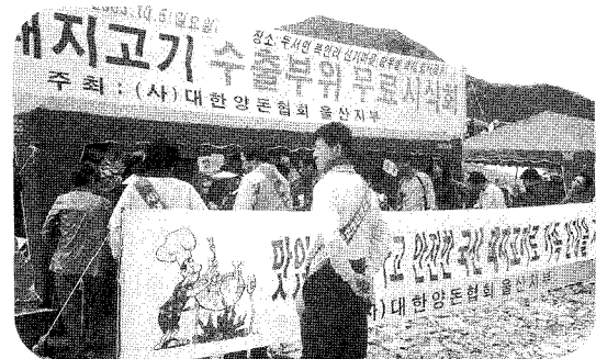
▲지난 2003년 10월 5일 개최된 울산지부 돼지고기 무료시식회 해 문제를 해결해야 한다.”며, “협회는 지부에서 하는 이야기에 귀를 기울여 어려운 여건을 이해하고 제시된 의견을 반영해 나감으로써 양돈인들의 권익보호를 위해 최선을 다하기를 바란다.”고 강조했다. 마지막으로 이 지부장은 “차조금 사업이 처음으로 집행되는 만큼 시행착오가 나타날 수 있겠지만, 최대한 공정하고 효율적으로 전개되길 바란다.”고 말했다. 양돈