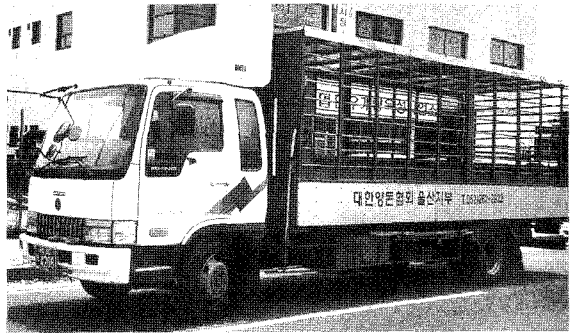
▲ 돼지출하차량을 운영하여 두당 1,200원 비용절감의 혜택을 제공하고 있다.

1,200원 비용절감의 혜택을 제공하고 있다. 월 2,000두 정도를 이 차량을 통해 출하하고 있으며, 1년간 2천880만원이 절감되는 것이다. 지역 양돈농가 출하차량을 일원화함으로써 외부로부터 질병유입 차단의 효과를 극대화하고 있다. 분뇨수거차량 및 돼지출하차량의 원활한 운영을 위해 배차 간격, 결산 및 수금 관리를 철저히 해나가고 있다.