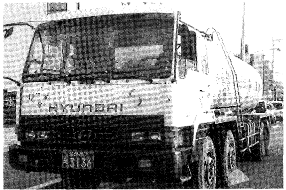
▲ 분뇨수거차량 운영을 통해 톤당 500원의 분뇨처리 비용절감의 기회를 제공하고 있다.