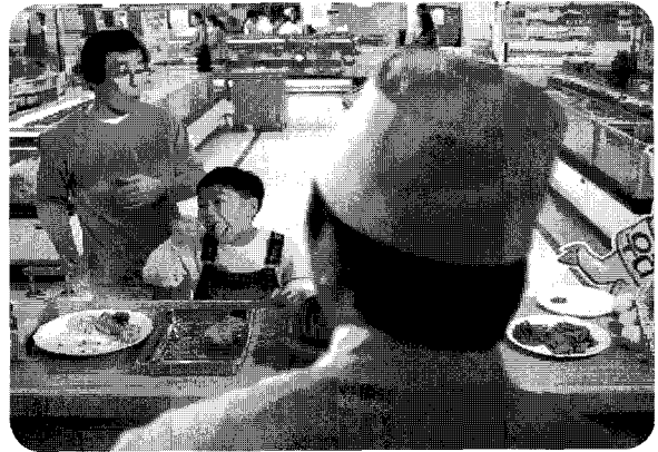
▲ 지난 2002년 11월, 12월 "우리는 돼지고기가 좋다."를 주컨셉으로 제작된 TV광고 방영 장면.

자조금은 법의 취지에 따라 그 운용·관리비용을 최소화하면서 대부분의 자조금이 국내산 돈육의 소비촉진을 위한 사업 즉, 돈육의 소비홍보 및 광고와 PR사업, 소비자 영양교육, 조사연구, 제품개발, 수출촉진 사업 등에 장단기적 계획에 따라 합리적이고 체계적으로 배분·사용됨으로써 국내산 돈육의 소비확대를 위한 효과가 최대화 되도록 해야 한다.