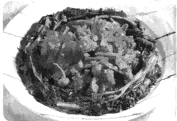
▲ 돼지고기 튀김고추볶음(돼지 뒷다리살 이용)

축산법은 농가가 조성한 자조금에 상응하는 범위의 금액 내에서 축산발전기금을 대응하여 지원할 수 있도록 규정하고 있다. 그러나 정부지원이 있다고 할지라도 자조금사업의 구체적인 사항에 대한 정부의 간섭은 배제되어야 한다. 양돈산업 발전과 관련된 다양한 업무에 있어서도 수급안정이나 방역사업 등과 같은 정부가 해야 할 일과 자조금사업으로 추진해야 할 일도 엄격히 구분해야 한다.