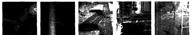
■ 탱크청소공사 ■ 탱크내부라이닝 ■ 탱크 및 배관보수 ■ 유류사고 긴급보수 ■ 탱크 용도폐지공사

서울 영등포구 양평동 5가 122번지 대표전화 : (02)2636-0997 TEL : (02)2678-0997/8, FAX : (02)2671-8725