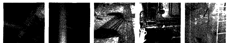
■탱크청소공사 ■탱크내부라이닝 ■탱크 및 배관보수 ■유류사고 긴급보수 ■탱크 용도폐지공사

서울 영등포구 양평동 5가 122번지 대표전화 : (02)2636-0997