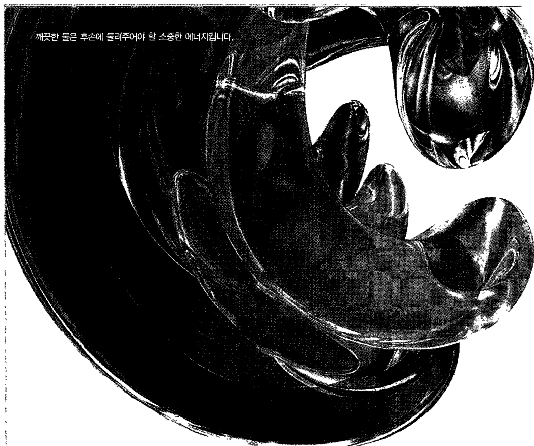
깨끗한 물은 후손에 물려주어야 할 소중한 에너지입니다.

이번 중국대회에 한국 직능단체 회원들의 참가인원은 모두 1,000여명으로 예상되고 있으며, 우리협회에서도 임원 및 지부장, 지부임원 일부가 참여할 예정이다.