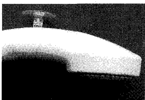
▲ 흡착기가 부착된 편리한 샤워기

이처럼 작은 발명도 가족들에게 물을 절약하는 교육을 체험케 하고, 또 사랑하는 가족들이 편리하게 샤워하고 머리를 감을 수 있게 해준다. 이렇게 많은 사람들이 무심코 지나쳐버린 것들을 누군가가 발명하여 발명가가 되고, 또 그것이 상품화되어 큰 돈까지 벌고 있는 것이다. 따라서 발명하는 여러분은 이제 눈을 크게 뜨고 주위를 살펴보아야 한다. 아직도 여러분의 주변에는 수많은 더하기 발명의 대상이 여러분의 선택을 기다리고 있다.