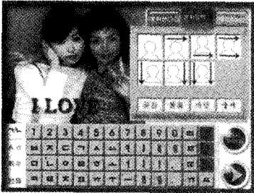
6종의 폰트와 12종의 테두리를 이용해 문자입력 및 꾸미기가 가능하다.

드림스탬프 자판기는 스티커자판기에서 진보된 새로운 어뮤즈먼트자판기이다. 이 제품은 이용자가 찍은 사진을 스탬프로 제작해 장기적으로 활용할 수 있게 한 점이 스티커자판기와의 차별화 요인이다.