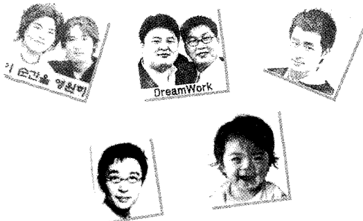
드림스탬프의 선명한 날인 사진

드림웍은 제품의 주이용층이 될 10대에서 20대 중반 층을 집중 겨냥하는 소비자 마케팅과 잠재사업자들을 겨냥한 마케팅을 병행해 나갈 예정이다.